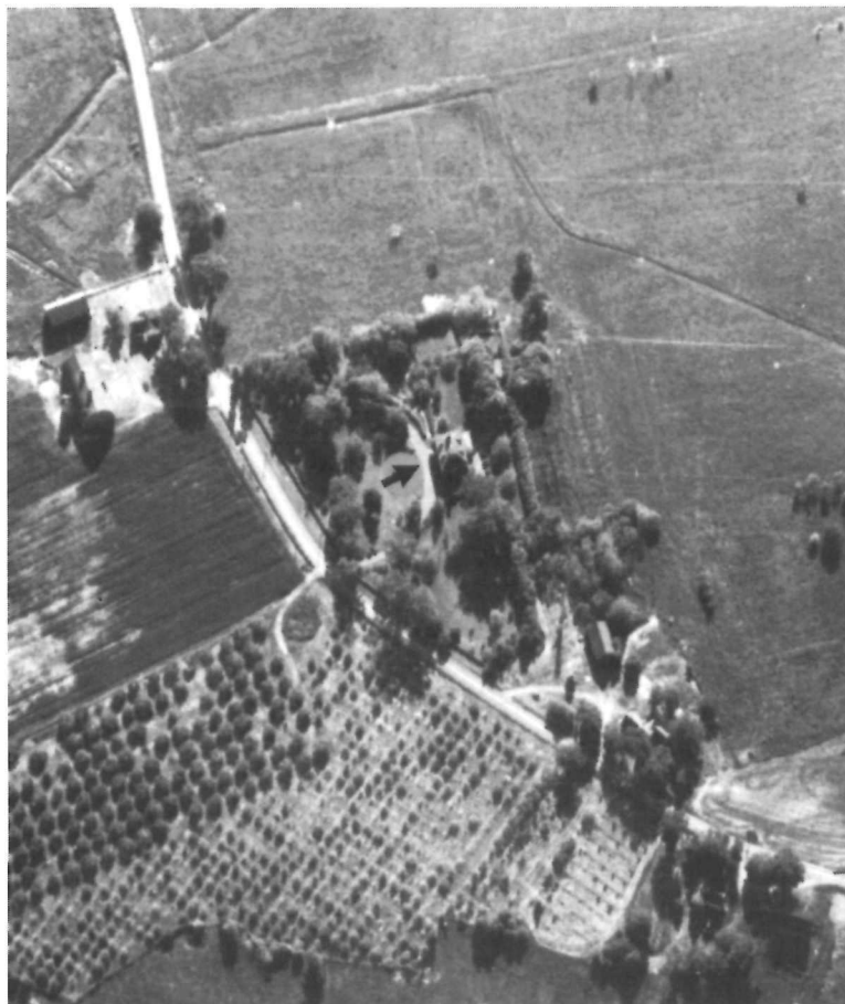
Photo aérienne d'Acacia Grove en 1967. Dès le XIX e siècle, la vallée de l'Annapolis est reconnue pour la richesse de ses vergers. Prescott a beaucoup fait pour y promouvoir la culture des arbres fruitiers, notamment en introduisant diverses variétés de pommiers.