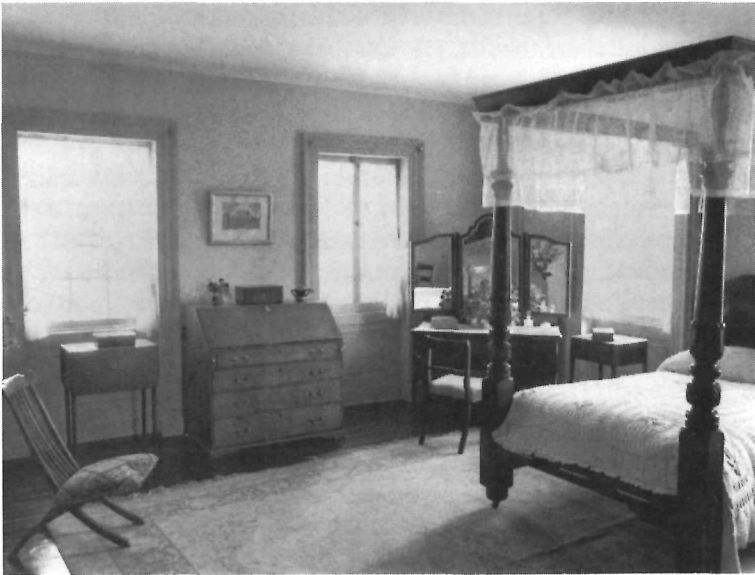
Une des quatre chambres à coucher du premier étage; on peut y admirer un imposant lit à baldaquin.