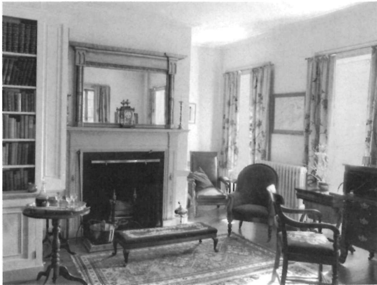
La bibliothèque. L'élégance et le raffinement de la décoration se manifestent dans les délicates moulures de cheminée. Celle-ci est surmontée d'un miroir bordé de colonnettes tournées supportant un large entablement.