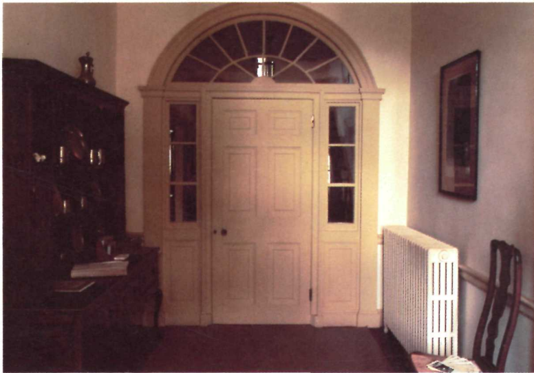
La porte entre les deux halls. Ses pilastres, ses panneaux moulurés ou vitrés et son imposte à réseau en font un ensemble imposant.