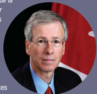
L'honorable Stéphane Dion, ministre de l'Environnement