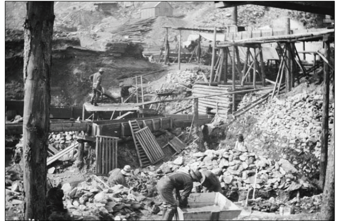
Au travail dans une concession au ruisseau Bonanza.

Quelques jours à peine après la découverte aurifère, les ruisseaux Bonanza et Eldorado furent jalonnés de bout en bout. La ruée vers l'or se déclencha dès que le reste du monde apprit la nouvelle de la découverte. La vallée devint le théâtre de l'excitation de centaines de gens creusant sans vergogne le lit des ruisseaux. Bientôt, les mineurs exploitaient chaque ruisseau et chaque colline du Klondike. Certains pensaient que l'or coulait à flots indéfiniment. Pourtant, l'or facile à trouver disparut en quelques années seulement. En 1899, la découverte d'un filon d'or à Nome, en