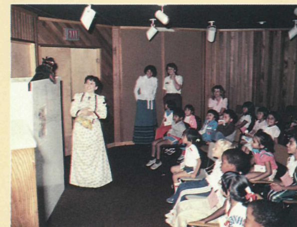
Des guides, en costumes d'époque, sont à la disposition des groupes scolaires. Costumed staff conduct school programmes.

Le parc historique national de Woodside est situé au 528, rue Wellington Nord. Des écriteaux placés le long des principales voies d'accès à Kitchener indiquent comment la trouver. Si l'on emprunte le «Conestoga Parkway» (route 86), il faut prendre la sortie Wellington Ouest.