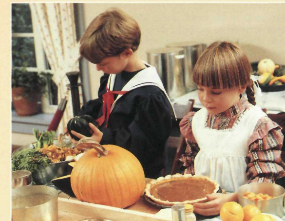
Reliving daily life in the 1890s. La vie de tous les jours en 1890.

been when the Kings lived there. Guides in period costume serve hot apple cider and baked goods. Christmas films and a programme of Christmas carols add to the festive atmosphere of the house.