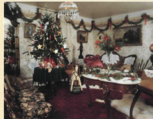
The parlour decorated at Christmas. Les décorations de Noël au salon.

The Victorian Christmas celebrations are the highlight of the year. During December, Woodside is decorated as it might have