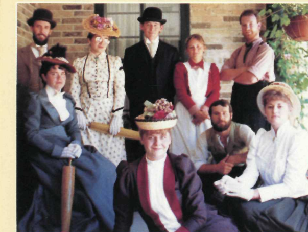
Costumed staff gather for the annual garden party. Le costume d'époque est de mise lors d'une réception en plein air.

Woodside is located at 528 Wellington Street North. Signs situated along the major roads entering Kitchener direct visitors to the site. If using the Conestoga Parkway, (hwy. 86) visitors should take the Wellington Street West exit.