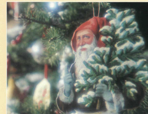
Décorations de Noël vers 1890. Christmas decorations of the 1890s.

Mais l'événement de l'année, à la maison Woodside, c'est le Noël victorien. En décembre, la maison est décorée comme elle aurait pu l'être au moment où les King l'habitaient. Des guides en costumes d'époque servent du cidre chaud et des pâtisseries. Des