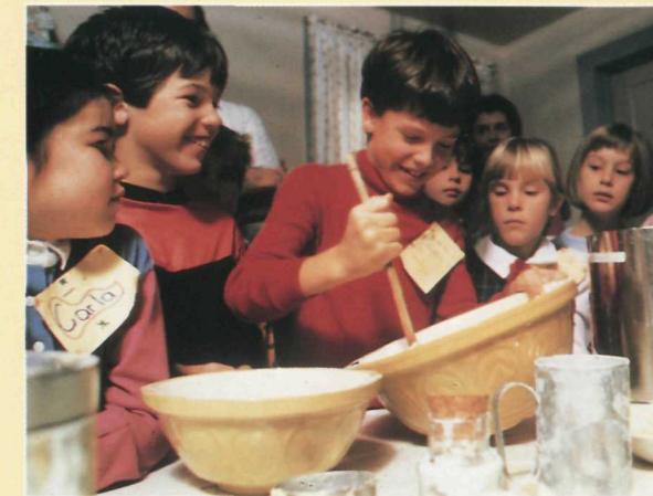
Un coup d'oeil sur le passé. Getting a taste of the past.

films et surtout un spectacle de chants de Noël embellissent l'atmosphère.