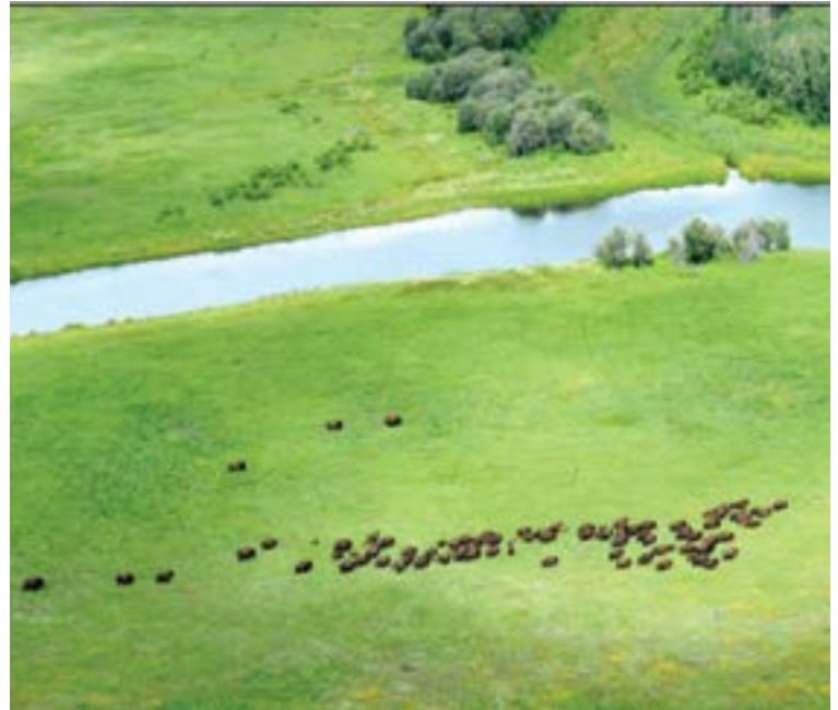
Bison dans le delta des rivières de la Paix et Athabasca.