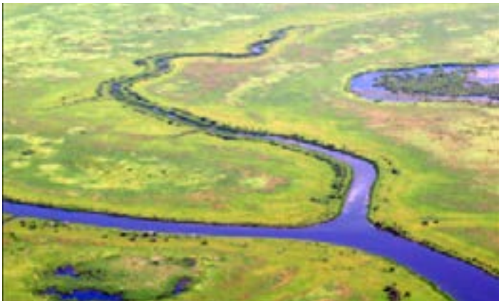
Le delta des rivières de la Paix et Athabasca.

cumulés des aménagements et du changement climatique sur les valeurs universelles exceptionnelles du parc.