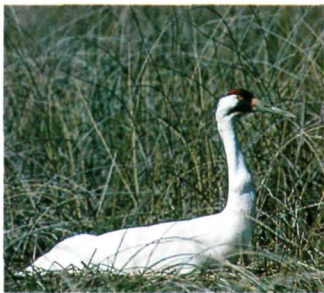
Nesting whooping crane. Nid de grue blanche d'Amérique.