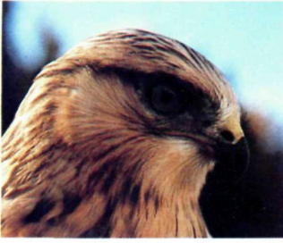
Rough-legged hawk. Buse pattue.

COVER The Salt Plains. COUVERTURE Les Plaines salées.