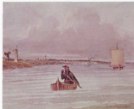
Le fort Wellington et le Moulin à vent près de Prescott après la rébellion.

En 1923, le fort Wellington fut déclaré site historique national. Actuellement, c'est Parcs Canada qui l'administre; on a restaurés les bâtiments et ses remparts de terre afin de lui rendre son aspect de 1845, alors qu'une compagnie du Royal Canadian Rifle Regiment l'occupait.