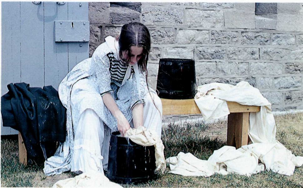
Femme de Soldat faisant la lessive. A soldier's wife doing a traditional chore.