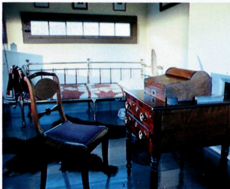
◀ Chambre d'officier Officer's Bedroom

Le valet de l'officier était choisi parmi les hommes de troupe. Il dormait dans la cuisine, sur une couchette qui, une fois repliée, servait de banc pendant la journée. Il entretenait le logement, prenait soin de l'uniforme de l'officier, et préparait les repas de ce dernier.