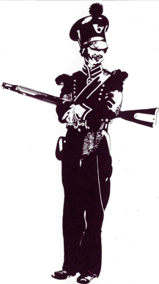
Un soldat du régiment des Royal Canadian Rifle, 1845.