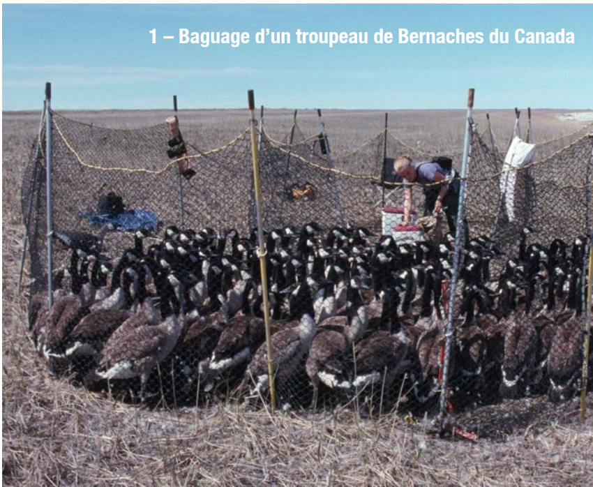
1 – Bagnage d'un troupeau de Bernaches du Canada