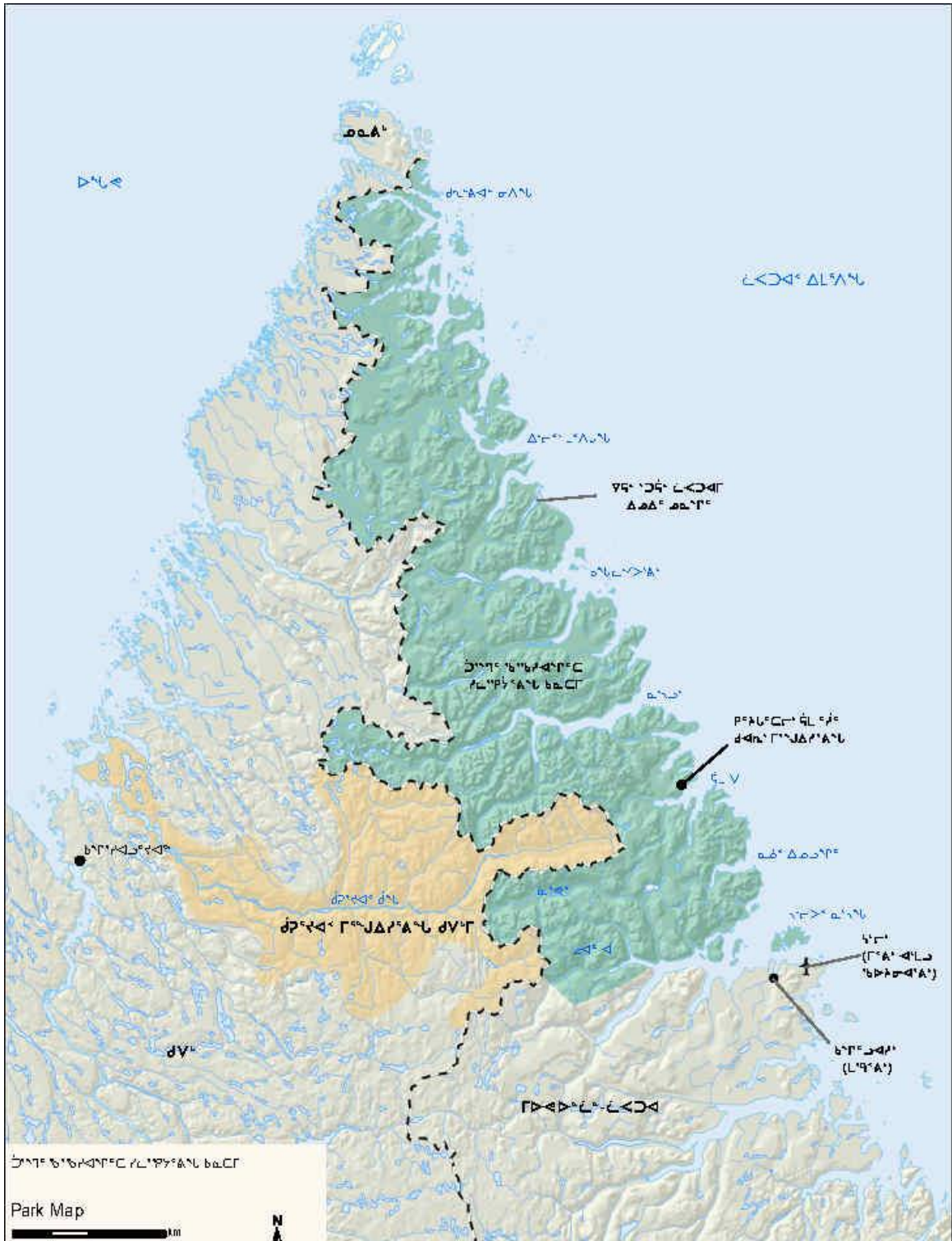
מ.מ.א. 1 ג.מ.א. מ.מ.א.