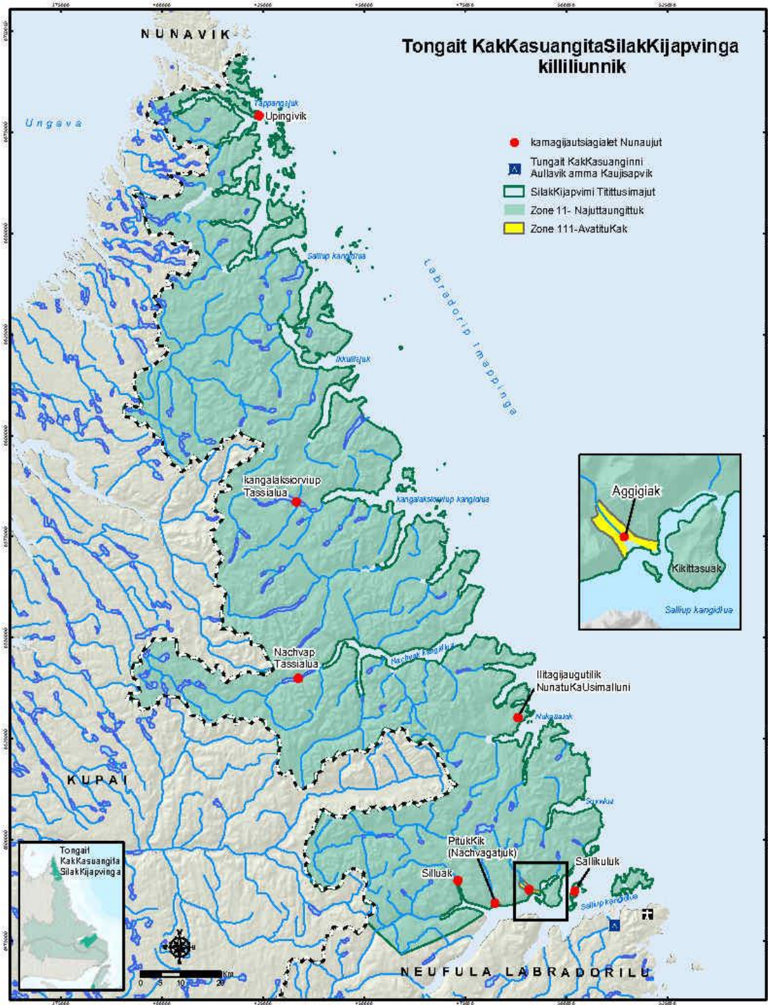
Map 3: Tongait KakKasuangita SilakKijapvinga killiliuttaumajut