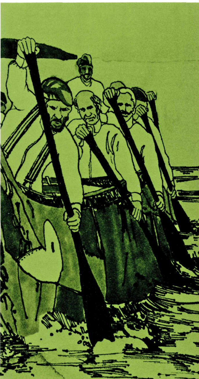
Illustration d'un canot "voyageur", par Ed Donald.