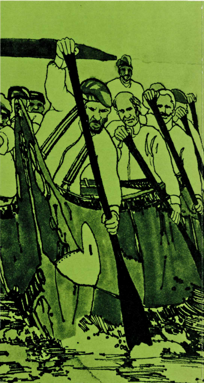
A "voyageur" canoe as illustrated by Ed Donald.

Far from being a forgotten phase in the distant past, Fort St. Joseph is today becoming part of the living record of Canadian history.