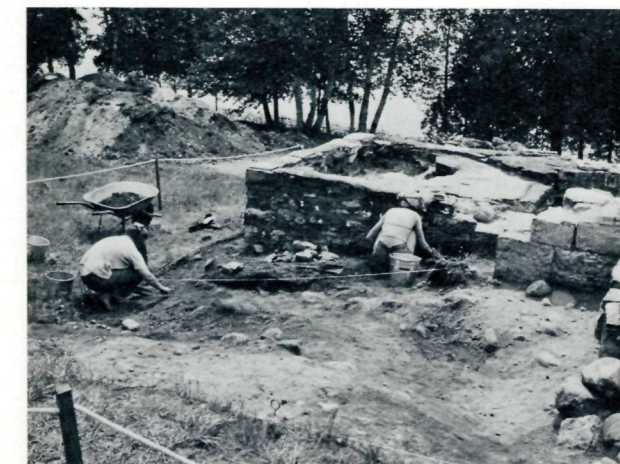
Each area is marked and precisely detailed to ensure accuracy. Chaque endroit est noté et détaillé de façon minutieuse afin d'assurer la précision.

It is interesting to note that in the archaeologists' report from this dig made mention of finding a valuable collection of ceramics while tracing the palisade walls and not while excavating building structures as one might expect. In summarizing his report, J.N. Emerson, University of Toronto Depart-