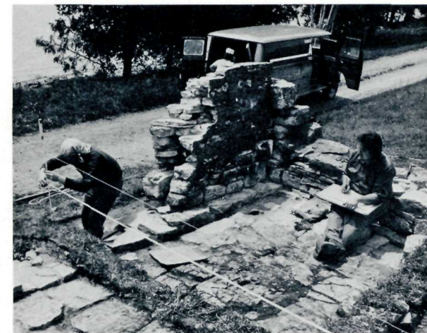
Des mesures précises sont relevées à chacune des fouilles. Precise measurements are made at each "dig".

En 1975, on examina les restes de la boulangerie et des maisons des trafiquants de fourrures. Ces dernières pourraient en révéler beaucoup sur la vie quotidienne de leurs habitants, car il semble que le sol où elles se dressaient, n'ait jamais encore été fouillé et l'on s'attend à des trouvailles intéressantes.