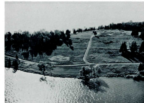
Vue aérienne du site du fort St-Joseph. An aerial view of the Fort St. Joseph site.

En 1974, les excavations se centrèrent sur le blockhaus, la poudrière, le bastion ouest, le mur nord-ouest de la palissade, une cheminée relativement intacte reliée à une structure qu'on n'a pu identifier avec certitude, mais qui aurait pu servir d'abri aux marchands de pelleteries. Mentionnons quelques-uns des objets trouvés: des clous de fer, d'autres en cuivre, une longue penture de métal, des fragments de poterie, des éclats de verre prove-