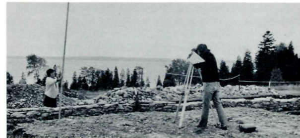
Archaeological surveyors map blockhouse ruins. Les ingénieurs archéologiques dressent une carte des ruines du blockhaus.

Under the terms of the Treaty of 1783, all territory south of the Great Lakes was awarded to the new republic of the United States. In the northwest the British had to give up Fort Michilimackinac, the gateway to the Upper Lakes. Traditionally it had been a key trading centre for the rich fur area to the south