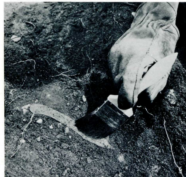
Un couteau à écorcher est mis à découvert par un archéologue. A skinning knife is delicately uncovered by archaeologist.

sentaient le besoin de s'entourer de fortifications pour se protéger des indigènes dont ils envahissaient le territoire avec le succès que l'on sait. Maintenant, une autre raison jouait dans l'édification du fort: le voisin américain, si proche qu'il fût par ses origines, ne serait pas toujours nécessairement paisible et la frontière contournaient justement la pointe de l'île où s'établissait le nouveau poste de traite. D'ailleurs, les intentions proprement belliqueuses n'étaient probablement pas absolument absentes. Des soldats britanniques, une milice canadienne et des Indiens, partirent un jour de 1812 du fort St-Joseph pour aller reprendre Michilimackinac aux Américains. Ainsi s'explique le fait que le fort St-Joseph fut détruit en 1814. L'ennemi se vengeait.