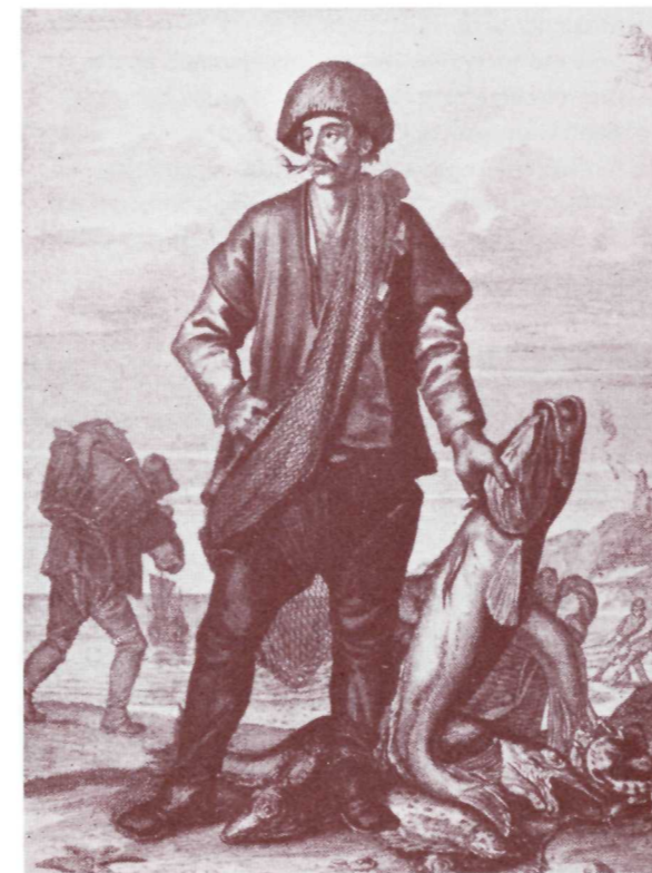
18th century fisherman Un pêcheur du 18e siècle

After 1749 the English-French conflict in Acadia accelerated. The unhappy Acadians on the mainland, who wished only to be left alone, found themselves caught in an international great power conflict, lost the struggle to remain neutral, and, following the capture of Fort Beauséjour by the British in 1755, were expelled from their homeland for refusing to swear unqualified allegiance to Britain. Of those who escaped the British transports, thousands fled to Ile Saint-Jean where the population climbed from barely 650 in 1747 to almost 5,000 by 1756. On an island already suffering the effects of crop failures, the destitute Acadian refugees only added to the misery and chaos. Unfortunately, worse was to come.