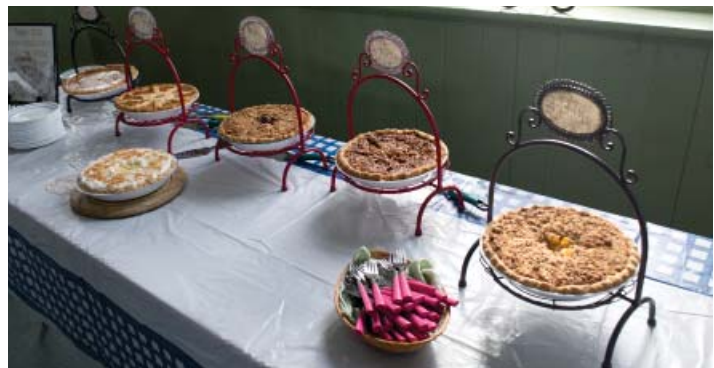
Myrna Burkholder a gracieusement concocté six de ses fameuses tartes maison pour la tournée du parc et, croyez-moi, elles sont tout aussi délicieuses qu'appétissantes!