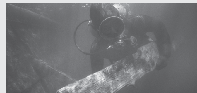
Recovery of a hull plank of the Machault (1969)

*Admission fees are currently being reviewed