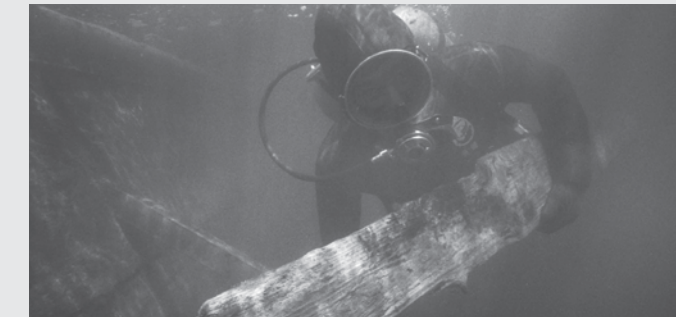
Remontée d'une planche de la coque du Machault (1969)