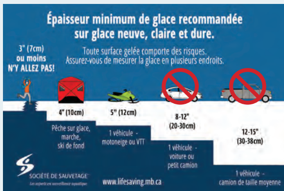
Illustration : © Société de sauvetage®. Utilisée avec permission.