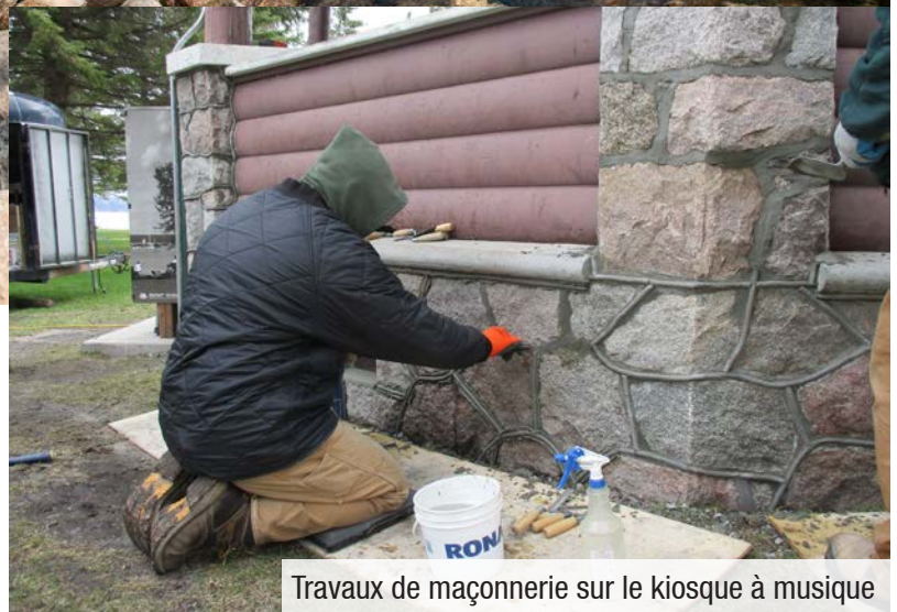
Travaux de maçonnerie sur le kiosque à musique

Si vous n'êtes pas encore allé du côté est du parc, le mont Agassiz est un magnifique endroit par où commencer! Les travaux d'aménagement paysager et sur les sentiers ont été achevés à l'été et à l'automne derniers. Une nouvelle salle de toilette sera installée cet été.