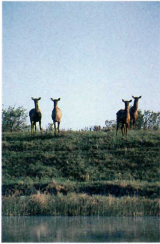
The gently rolling park landscape is home to herds of elk. Des troupeaux de wapitis ont trouvé refuge dans les régions vallonnées du parc.