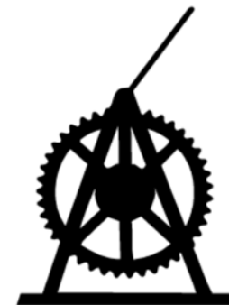
Canal Rideau Canal

Quand vous observez le fonctionnement d'une écluse sur le Canal Rideau, vous êtes en présence d'une merveille d'ingénierie qui se sert de l'eau, de la gravité, de la puissance musculaire de l'homme et d'un système élémentaire de leviers et de rouages pour permettre aux embarcations de monter ou de descendre jusqu'à un autre niveau d'eau.