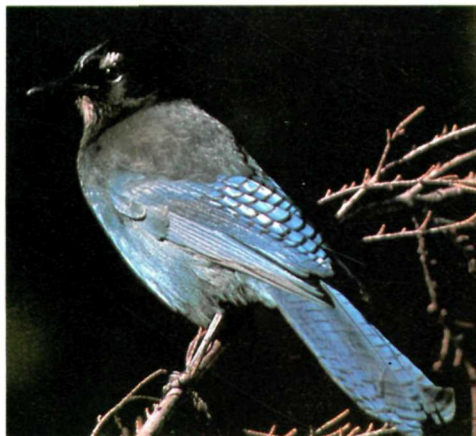
Blue jay. Geai bleu.