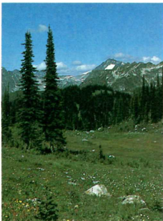
Meadows covered by colorful wildflowers. Les prés colorés de fleurs sauvages.

Published by authority of the Minister of the Environment ©Minister of Supply and Services Canada 1983 Publié en vertu de l'autorisation du ministre de l'Environnement ©Ministère des Approvisionnements et Services Canada 1983 OS-R121-000-BB-A1