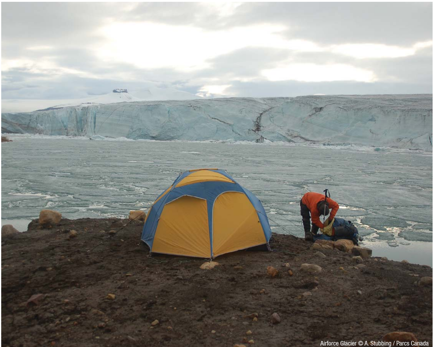
Airforce Glacier

Ce sont les frais au moment d'aller sous presse. Des nouveaux frais seront bientôt appliqués, légèrement à la hausse.