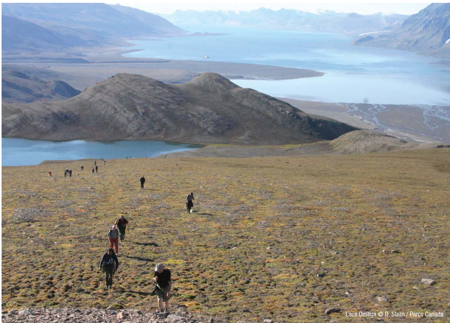
Lacs Omega

Les randonneurs peuvent explorer le parc à partir de la station du fjord Tanquary. Les visites à l'historique Fort Conger sont possibles sur permission spéciale et nécessiteront qu'un employé de Parcs Canada accompagne votre groupe.