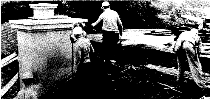
Une équipe de couvreurs enlève les bardeaux d'asphalte avant de poser les nouvelles ardoises. On aperçoit une cheminée de pierre reconstruite sur le modèle d'origine.

devant être très minutieuse, on décida de procéder d'abord à la restauration de l'extérieur.