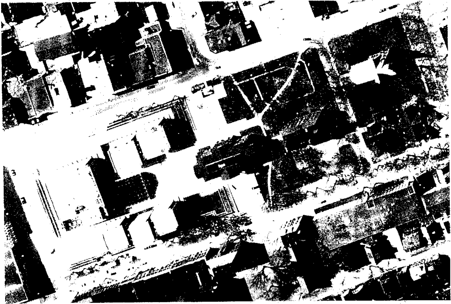
Figure 1 Queen's Square : LHC Province House au centre, en 1876, palais de justice (maintenant le bâtiment de l'honorable George Coles) à droite, 1969