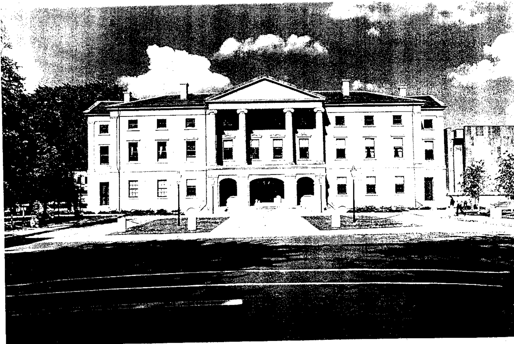
Figure 2 Lieu historique national Province House, 1985