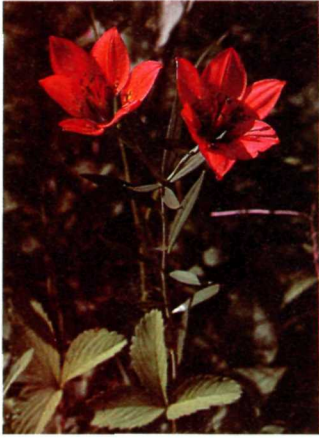
Western red lily Lil rouge orangé