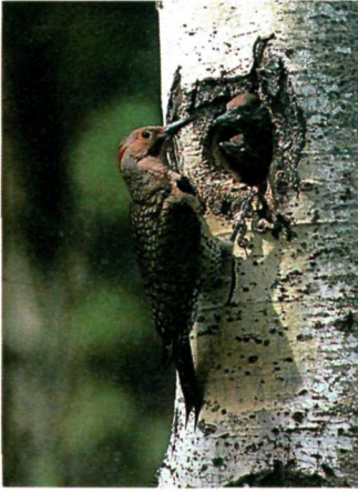
Yellow shafted flicker and young. Un pic doré et son oisillon.