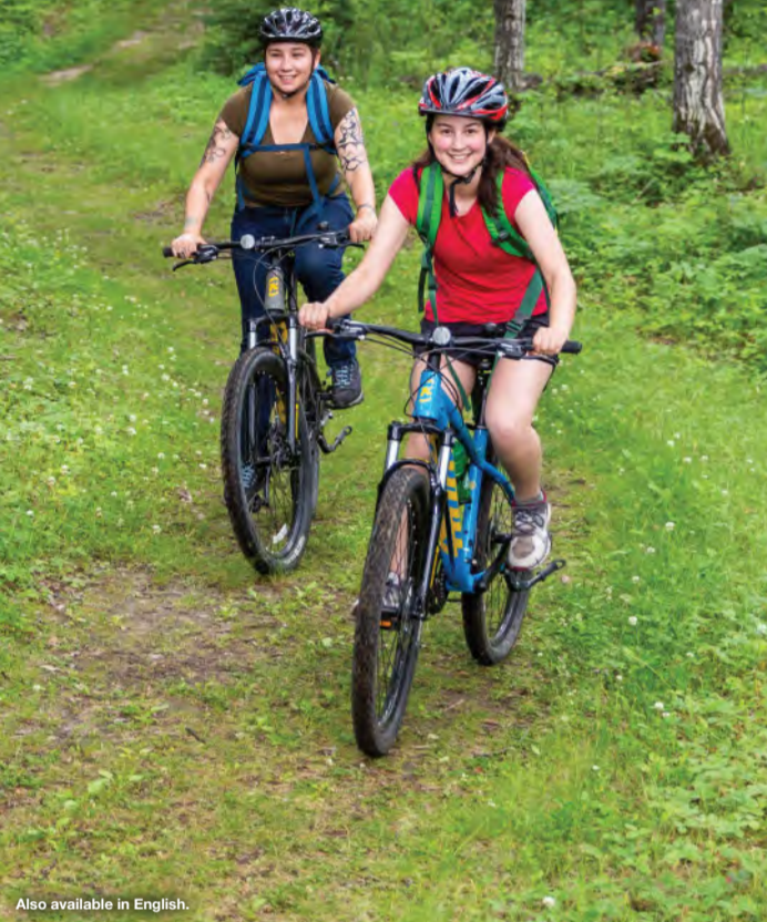
Also available in English.