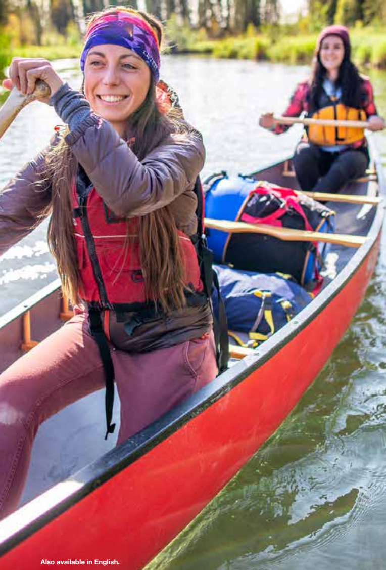
Also available in English.