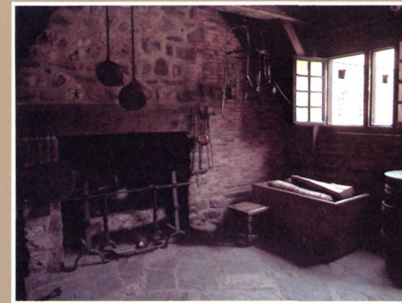
Gourmet feasts originated in this kitchen. Dans cette cuisine, on préparait des festins de roi.