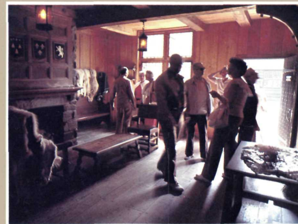
La résidence du gouverneur, reflet d'un style de vie austère. Governor's quarters reflect austere lifestyle.

Le vaisseau de ravitaillement de De Monts, sous les ordres de Poutrincourt, n'arriva pas avant la fin de juillet 1606. Parmi les nouvelles recrues pour la colonie, il y avait Biencourt, le fils de 15 ans de Poutrincourt, Marc Lescarbot, Louis Hébert un apothicaire, et Robert Du Pont Gravé, fils