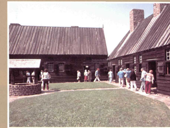
Restored gentlemen's quarters prove popular. Les maisons des gentilhommes sont populaires.