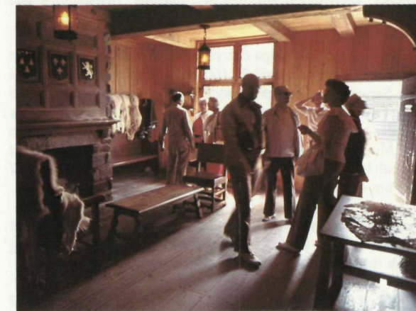
La résidence du gouverneur, reflet d'un style de vie austère. Governor's quarters reflect austere lifestyle.

En 1606, Le Sieur de Poutrincourt revint dans la colonie en compagnie de Marc Lescarbot, avocat au Parlement de Paris. Lorsque de Poutrincourt et Champlain décidèrent de poursuivre leurs explorations, le commandement de l'Habitation fut confié à Lescarbot. Pour fêter le retour des explorateurs, Lescarbot écrivit, mit en scène et dirigea une pièce intitulée