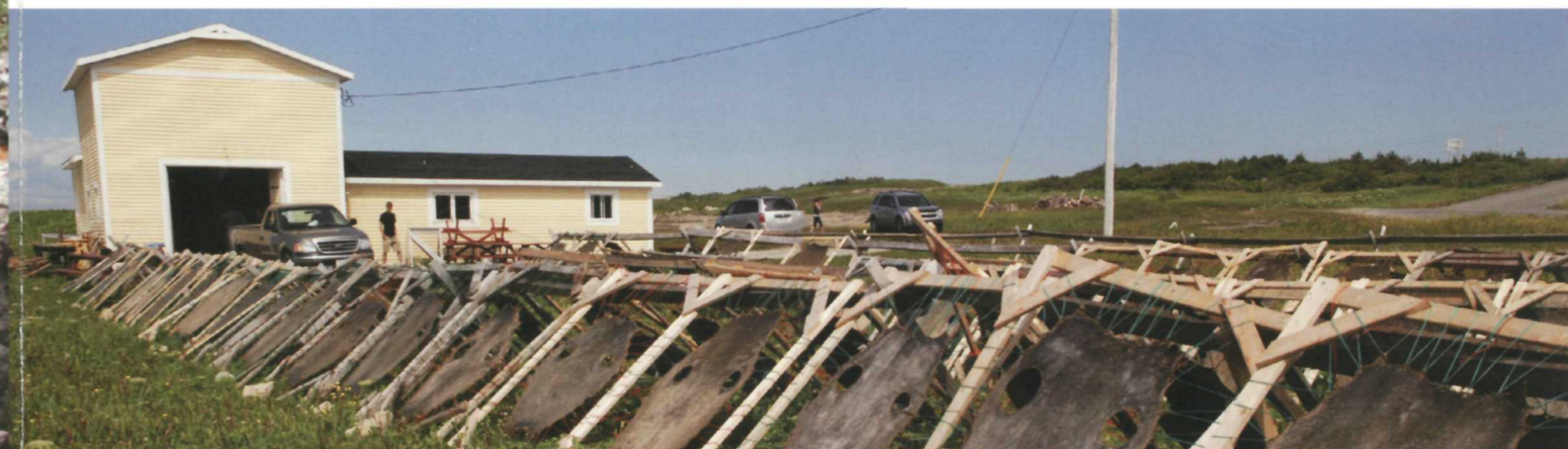
Vue de la côte nord de la péninsule de Point Riche