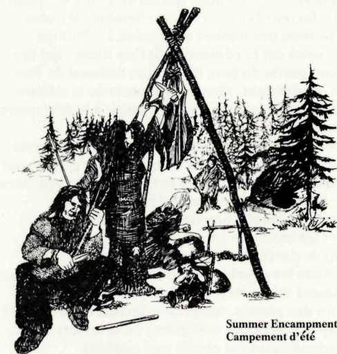
Summer Encampment Campement d'été

shell pendants around their necks. And, while a number of bones, bills, claws and teeth were also clearly sewn on garments, to these a meaning greater than simple decoration is evident.