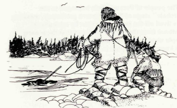
2 Hunters make a kill Deux chasseurs à l'oeuvre

abrasif de grès ou de quartzite. Les tombeaux contenaient des échantillons marquant toutes les étapes de la fabrication, sans doute dans le dessein de permettre au défunt de compléter dans sa vie future ceux qui n'étaient pas terminés.