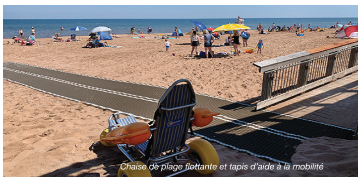
Chaise de plage flottante et tapis d'aide à la mobilité