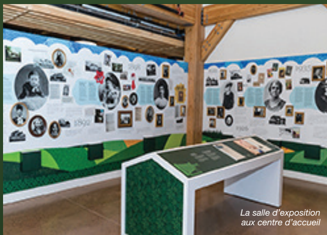
La salle d'exposition aux centre d'accueil