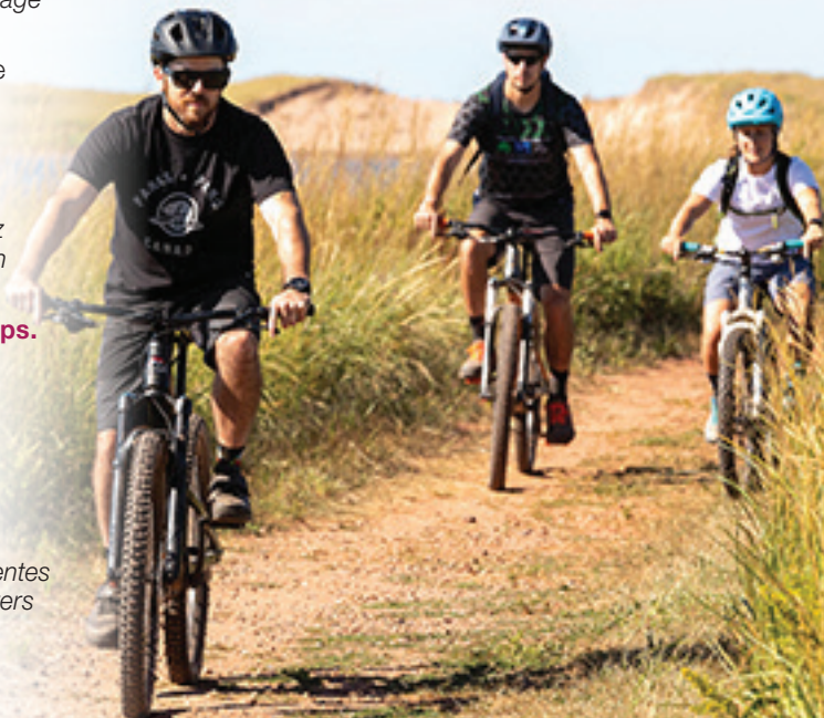
Sentier Homestead, Cavendish