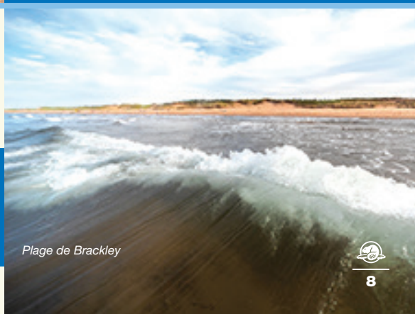
Plage de Brackley

Remarque : Nous analysons notre eau de manière régulière selon des normes élevées. À moins d'indication contraire, l'eau est potable partout.