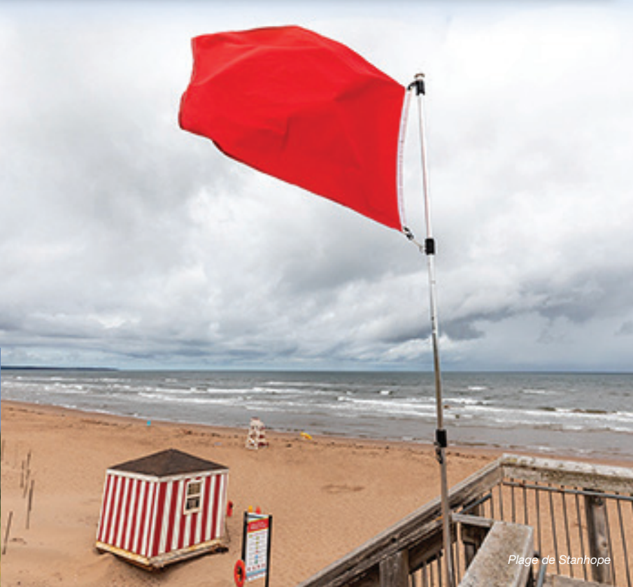
Plage de Stanhope

Parcs Canada et ses fournisseurs de services mettent tout en œuvre pour indiquer les zones connues des courants d'arrachement. Toutefois, il se pourrait qu'il y ait d'autres secteurs qui ne sont pas marqués.