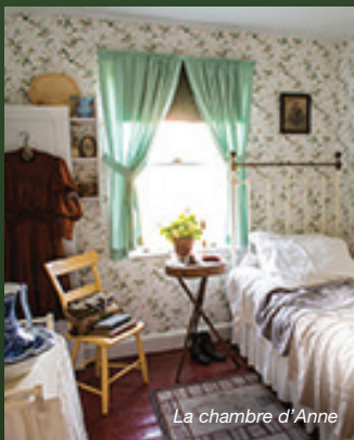
La chambre d'Anne

Aujourd'hui, les visiteurs trouveront que la maison et le terrain du site patrimonial Green Gables ont été superbement restaurés et décorés dans les moindres détails afin de correspondre au monde décrit par Montgomery dans son roman. Les expositions du centre d'accueil et de la grange commémorent la vie, la carrière et l'œuvre de renommée internationale