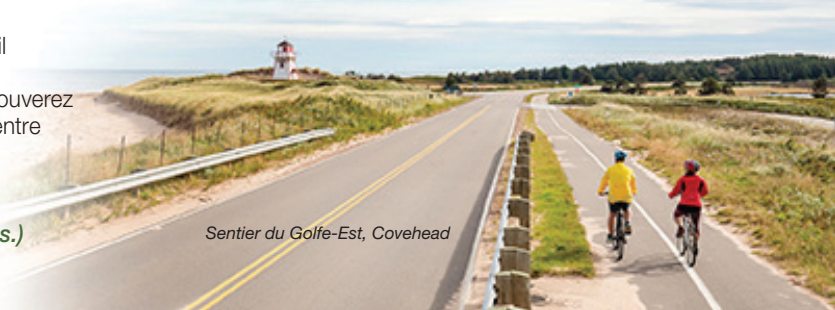
Sentier du Golfe-Est, Covehead

Pour obtenir plus d'informations, vous pouvez nous joindre par courriel à pc.pnipe-peinp.pc@canada.ca ou par téléphone au 902-566-7050 .