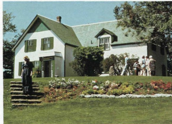
La maison Green Gables Green Gables House

La maison Green Gables se trouve à Cavendish, à l'extrémité ouest du parc. C'est la maison de ferme immortalisée dans le roman classique de Maud Montgomery "of