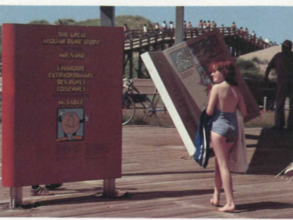
Mr. Sand Exhibit, Cavendish L'exposition de monsieur Sable, à Cavendish

These are provided year round and are designed to help you discover the natural and human history of the Park.