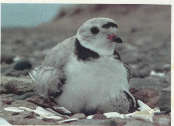
Le pluvier siffleur Piping Plover

Les feux de camp sont interdits dans le parc, quoiqu'on peut allumer des barbecues sur les terrains de camping et dans les aires de pique-nique; il faut se débarrasser des braises avec soin.