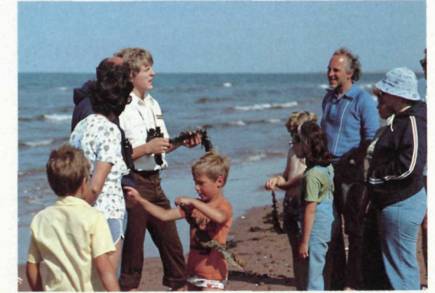
Interpretive Beach Walk Promenade d'interprétation sur la plage

Green Gables House is located at the far western end of the Park in Cavendish. This charming farmhouse is known internationally through Lucy Maud Montgomery's classic novel "Anne of Green Gables", as the house where "Anne" lived. While at Green Gables you may trace "Anne's" footsteps down Lover's Lane, through Balsam Hollow and around the Lake of Shining Waters.