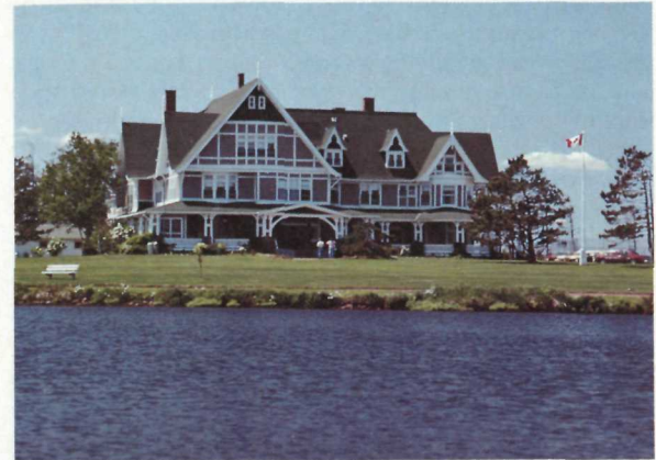
Dalvay-By-The-Sea Hotel L'hôtel Dalvay-By-The-Sea