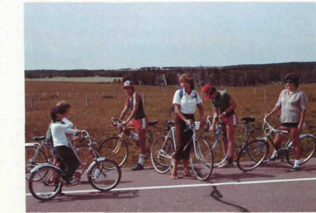
Bicycle Touring Promenade à bicyclette

Under the influence of storm waves and winds, these barrier islands then migrate shoreward depositing large quantities of sand along the shore resulting in the extensive beaches seen today. The beach sand is then driven further onshore by wind action and trapped by marram grass; this results in the formation of our coastal dunes.