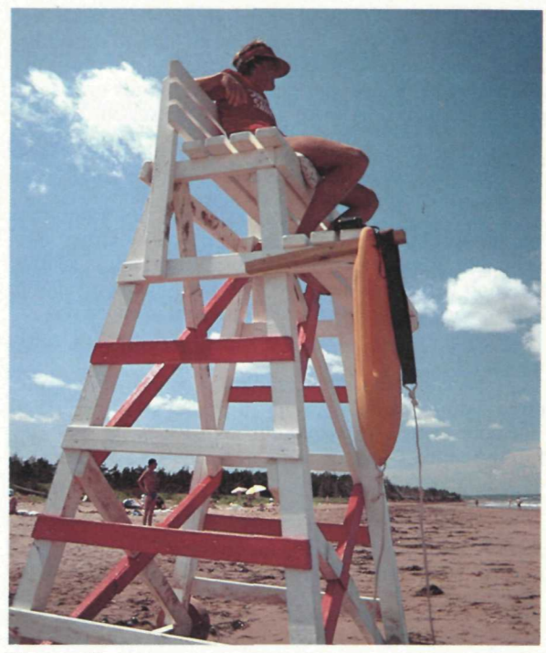
Plage surveillée Supervised Beach

Les parcs nationaux permettent de conserver, à l'état naturel, des régions choisies du pays. Il importe de garder