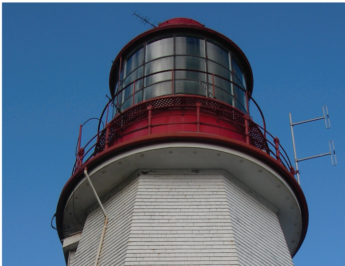
Réserve de parc national du Canada Pacific Rim

Les Premières Nations Ditidaht offrent du camping confort sous la tente sur leur territoire traditionnel sur RI2 à Tsuquadra. Les tentes pour quatre personnes sont munies de poêles à bois, de plancher en bois, de lits de camp et de terrasses extérieures. Veuillez consulter la section Contact à la page 13.