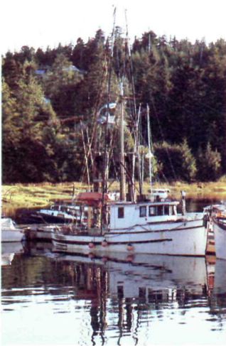
The West Coast Trail unit, the southernmost sector of Pacific Rim National Park. Le sentier West Coast se trouve dans la partie la plus au sud du parc national Pacific Rim.

Small fishing communities adjacent to the park provide visitor services and accommodations. De petits villages de pêche se trouvent à proximité du parc et offrent aux visiteurs services touristiques et logement.