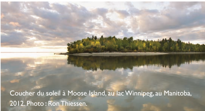
Coucher du soleil à Moose Island, au lac Winnipeg, au Manitoba, 2012.