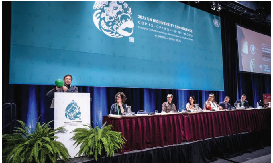
L'Appel de Montréal lancé le 8 décembre lors de la COP15.

Le Collectif COP15, dont a activement fait partie la SNAP Québec, a réussi à sensibiliser de très nombreux décideurs politiques et le grand public a une multitude d'enjeux liés à la protection du vivant. Plus de 60 événements ouverts au grand public ont été organisés en