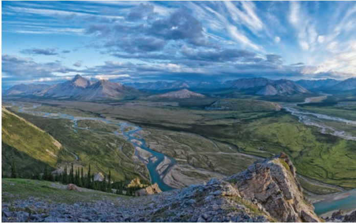
Le ruisseau Royal se jette dans la rivière Wind, un affluent de la rivière Peel dans le nord du Yukon.