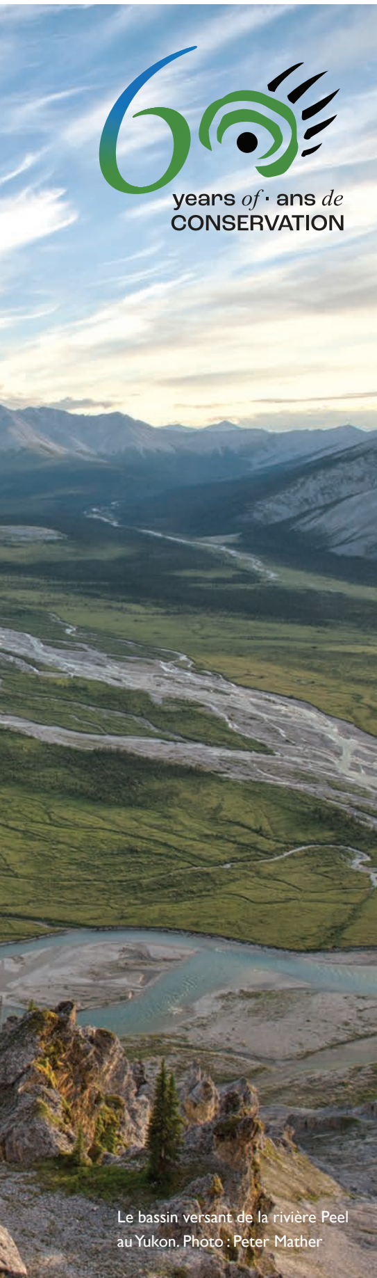
Le bassin versant de la rivière Peel au Yukon.