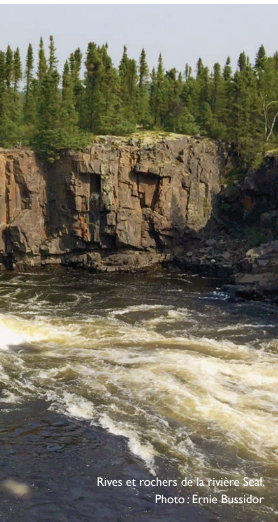
Rives et rochers de la rivière Seal.

« La SNAP a réellement aidé pour une partie du travail de mobilisation que nous avons dû faire, dit-elle. Obtenir le soutien des Manitobains et Manitobaines, c'est le genre de chose pour laquelle la SNAP excelle vraiment... Ils sont réellement fantastiques en matière de soutien, et nous leur en sommes vraiment reconnaissants et les remercions. »