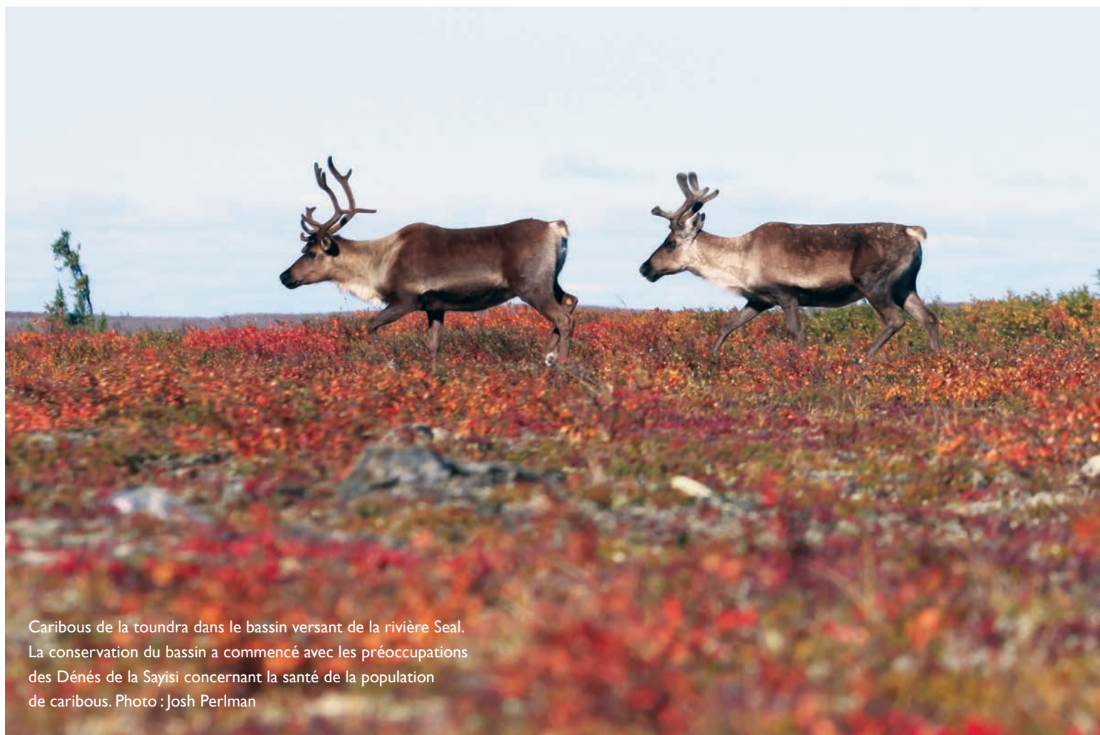
Caribous de la toundra dans le bassin versant de la rivière Seal. La conservation du bassin a commencé avec les préoccupations des Dénés de la Sayisi concernant la santé de la population de caribous.

La campagne pour le bassin versant de la rivière Seal compte parmi les plus récents exemples du travail de la SNAP au cours des dernières décennies en vue de se rallier aux efforts des Autochtones pour la création de vastes aires protégées sur les territoires traditionnels partout au Canada. Ce travail reflète la reconnaissance désormais fondamentale de la SNAP – qui a évolué au cours de ses 60 ans de conservation adaptée au milieu – quant au rôle central de la culture et de l'intendance autochtones.