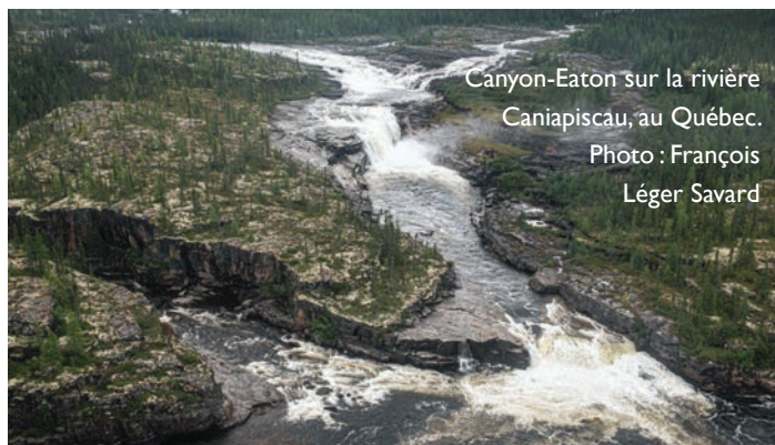
Canyon-Eaton sur la rivière Caniapiscou, au Québec.

En décembre 2020, le Québec a annoncé la protection additionnelle de 96 000 km 2 de territoire, devenant ainsi la deuxième province du Canada à atteindre la cible internationale de 17 % d'aires protégées. Le Québec est maintenant en tête de file au pays pour la superficie absolue d'aires protégées, avec plus de 257 000 km 2 , ce qui est plus grand que le Royaume-Uni. Ces résultats exceptionnels découlent d'années de travail ininterrompu par de nombreuses parties prenantes, dont la SNAP Québec et les dirigeants de plusieurs Premières Nations.