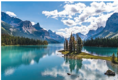
Le lac Maligne, dans le parc national Jasper.