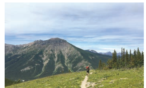
Castle Parks.

industrielles, comme l'exploitation forestière. Après les importantes activités de défense menées par des groupes locaux et des organisations de conservation, dont la SNAP Alberta sud, le gouvernement de l'Alberta a désigné le Castle comme Wildland and Provincial Park et a lancé une consultation sur un plan de gestion. Pour en savoir plus : cpaws-southernalberta.org/conservation/defend-the-castle .