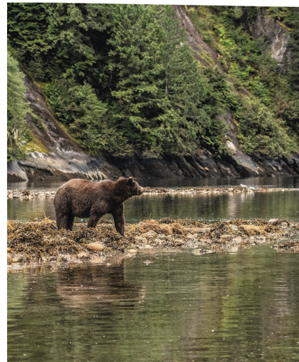
À droite: Un résident local de la forêt pluviale de Great Bear.