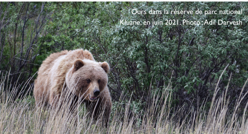
Ours dans la réserve de parc national Kluane, en juin 2021.