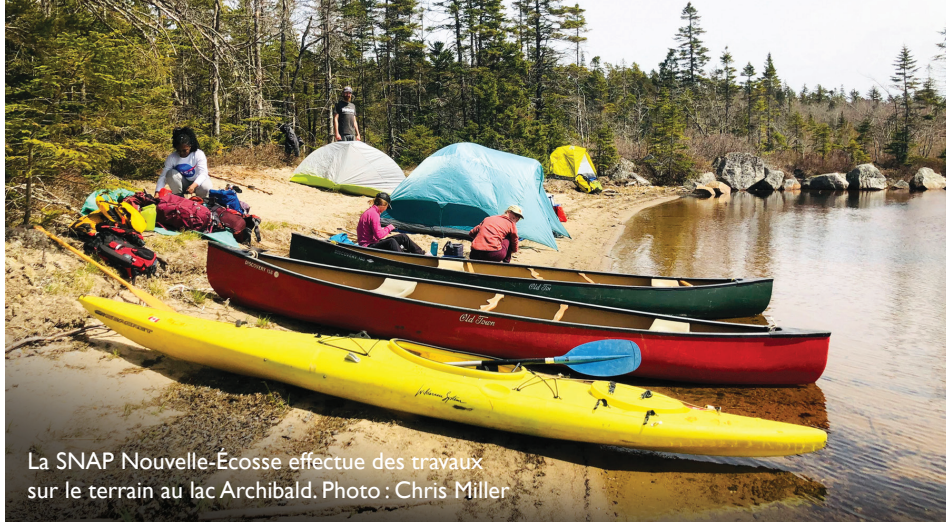
La SNAP Nouvelle-Écosse effectue des travaux sur le terrain au lac Archibald.