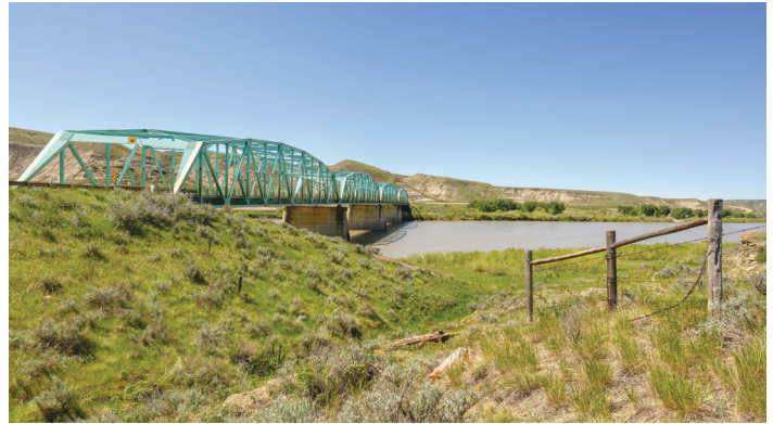
L'autoroute 41 (Buffalo Trail) traverse la rivière Saskatchewan Sud près du parc Sandy Point à Redcliff, en Alberta.