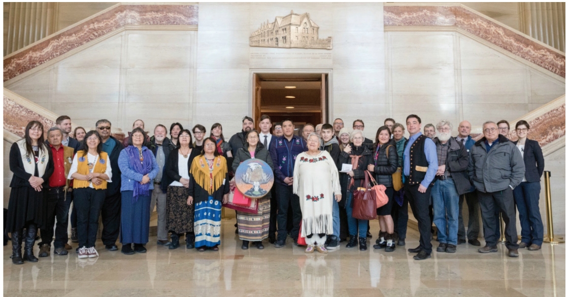
À droite : Des représentants des Tr'ondek Hwech'in, des Na Cho Nyak Dan, des Vuntut Gwitchin, du Conseil tribal des Gwich'in, de la Yukon Conservation Society et de la SNAP à la Cour suprême du Canada pendant la bataille judiciaire qui a permis d'assurer la protection de l'un des plus grands écosystèmes intacts en Amérique du Nord, le bassin hydrographique Peel du Yukon. d'Amérique du Nord, le bassin hydrographique de la rivière Peel au Yukon, en mars 2017.

Les sources indiquent qu'environ 80 aires protégées et de conservation à travers le Canada sont considérées comme des APCA par le gouvernement fédéral ou par les communautés autochtones. Des dizaines d'autres sont en phase de développement grâce au soutien financier d'Ottawa. En 2021, le gouvernement fédéral a annoncé un nouveau financement de 340 millions de dollars sur cinq ans pour soutenir la conservation et l'intendance dirigées par les Autochtones, dont plus de 166 millions de dollars pour les APCA.