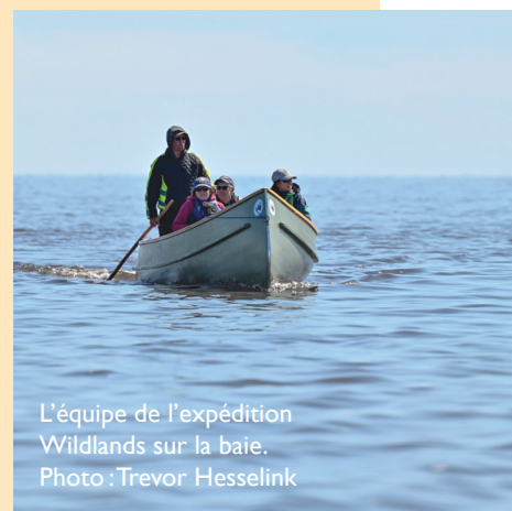
L'équipe de l'expédition Wildlands sur la baie.

La SNAP Wildlands League a effectué une incroyable expédition d'une semaine sur la côte de la baie d'Hudson. L'équipe est partie en compagnie de guides et de leaders autochtones, d'une équipe de tournage et de biologistes marins afin d'explorer ce magnifique paysage et de constater sur place le désir des Peawanuck de renforcer leurs capacités communautaires, de renforcer la surveillance environnementale et de protéger la biodiversité marine grâce à l'initiative de création d'une aire marine nationale de conservation (AMNC). Pour en savoir plus sur le travail de la Wildlands League dans la baie d'Hudson et la baie James en vue de la création d'une AMNC dans la plus grande mer intérieure du monde, rendez-vous sur marine.wildlandsleague.org .