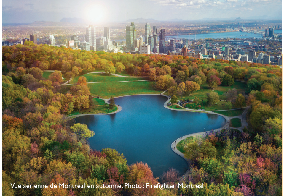
Vue aérienne de Montréal en automne.

« La SNAP doit absolument veiller à mobiliser les forces vives à l'approche de la COP et à encourager l'engagement politique au cours du sommet », renforce Mme Woodley. « Les gens du monde entier doivent comprendre que deux crises majeures sévissent : les changements climatiques et la perte de biodiversité. Si rien n'est fait pour les résoudre, c'est alors la santé de la planète et notre propre bien-être qui risquent de sombrer. »