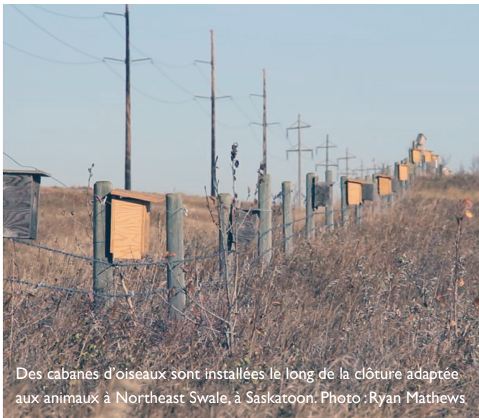
Des cabanes d'oiseaux sont installées le long de la clôture adaptée aux animaux à Northeast Swale, à Saskatoon.