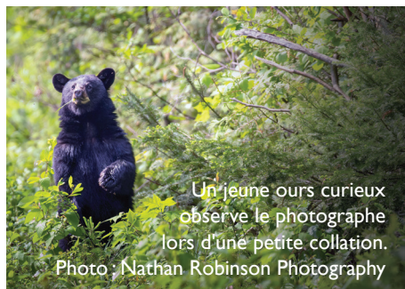
Un jeune ours curieux observe le photographe lors d'une petite collation.

Bien qu'il s'agisse d'un progrès notable, la SNAP NB encourage le gouvernement à collaborer avec les Nations autochtones pour mettre la province sur la voie de l'atteinte de ses futurs objectifs de conservation. Pour en savoir plus : cpawsnb.org/campaigns/protected-areas .