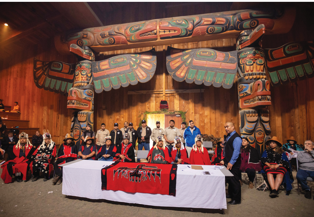
À gauche: Klemtu, le 21 juin 2022. La nation Kitasoo Xai'xais déclare une nouvelle aire marine protégée (AMP) à Gitdisdzu Lugyek.

Rippon Madtha, SNAP Colombie-Britannique