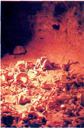
Gallery of the Dall sheep skeletons in Grotte Valerie. Des squelettes de mouflons de Dall dans la Grotte Valerie.