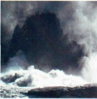
The upper edge of Virginia Falls. La rive supérieure des chutes Virginia. Riding the rapids below Virginia Falls. Descendre les rapides, en aval des chutes Virginia.

COVER — The Splits — channels in the lower South Nahanni River. Les Splits — chenaux dans la rivière Nahanni-Sud inférieure.