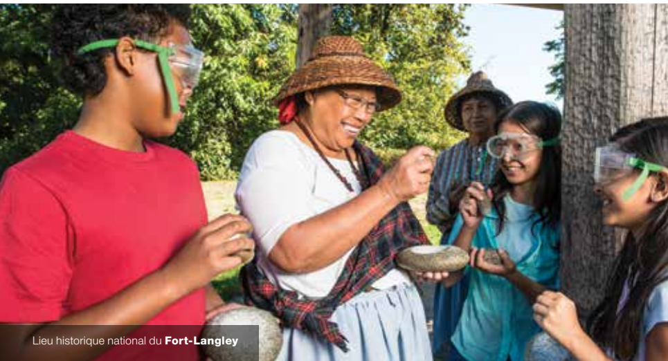
Lieu historique national du Fort-Langley

Les résultats des consultations de la Table ronde de 2017 laissent entendre que l'on pourrait repenser le rôle que les sites de Parcs Canada pourraient jouer à l'avenir. Pour ce faire, il faudra mettre l'accent sur plusieurs priorités, notamment celles-ci :