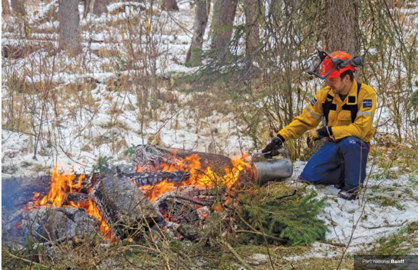
Parc national Banff

intention de protéger un territoire destiné à devenir une réserve de parc national dans le sud de la vallée de l'Okanagan.