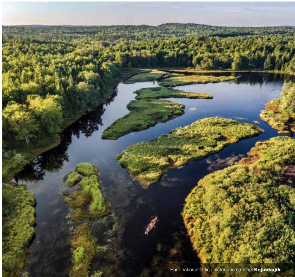
Parc national et lieu historique national Kejimikujik

La question de la pérennité porte sur les mesures visant à renforcer la gouvernance, à assurer un financement stable, à collaborer avec des partenaires externes et à faire en sorte que Parcs Canada rende compte de ses activités en facilitant l'accès aux rapports et en favorisant la participation du public.