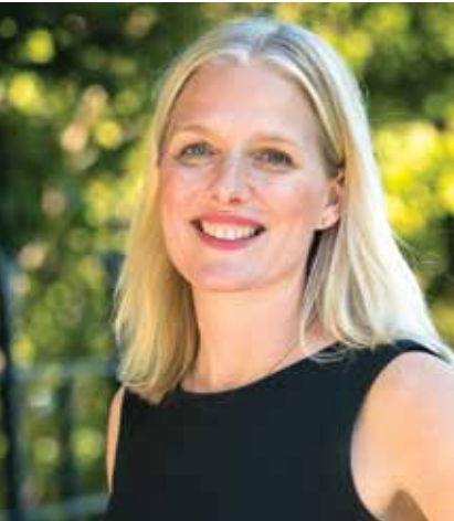
Catherine McKenna Ministre de l'Environnement et du Changement climatique

J'ai le grand honneur d'être la ministre responsable de Parcs Canada. Chaque jour, j'ai l'occasion de travailler avec l'extraordinaire personnel de Parcs Canada et de contribuer à inspirer les Canadiens et Canadiennes à renouer avec les merveilles naturelles et historiques de notre pays.