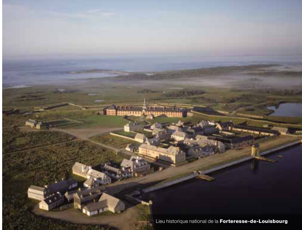
Lieu historique national de la Forteresse-de-Louisbourg

De nombreux participants ont parlé de la diversité croissante de la population canadienne et ont recommandé que les programmes de Parcs Canada tiennent compte des changements sociétaux en cherchant à savoir comment les différentes couches de la population entrent en contact avec ses endroits. Il faudrait aussi rendre les parcs nationaux et les lieux historiques nationaux plus accessibles aux personnes ayant des capacités différentes.