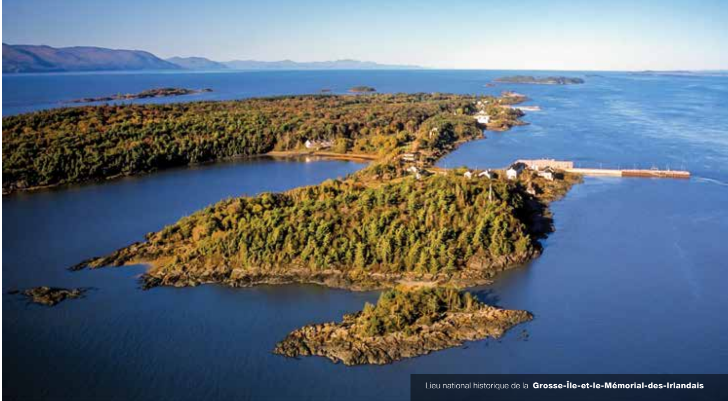
Lieu national historique de la Grosse-Île-et-le-Mémorial-des-Irlandais

du Canada. D'autres efforts ont été déployés pour inclure les connaissances traditionnelles autochtones à la recherche et les histoires autochtones à la littérature et à la mise en valeur de Parcs Canada. Il n'y a pas de relation plus importante que celle qu'a notre gouvernement avec les peuples autochtones.