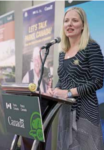
La ministre Catherine McKenna participant à une activité de Parlons de Parcs Canada!

La Loi sur l'Agence Parcs Canada (1998) exige que la ministre de l'Environnement et du Changement climatique tienne une table ronde tous les deux ans pour demander conseil à la population canadienne sur les questions relevant de Parcs Canada. La table ronde de la ministre appelée Parlons de Parcs Canada! était la huitième du genre à se tenir depuis 2001. Mais c'était la première fois qu'on invitait l'ensemble du public canadien à y participer.