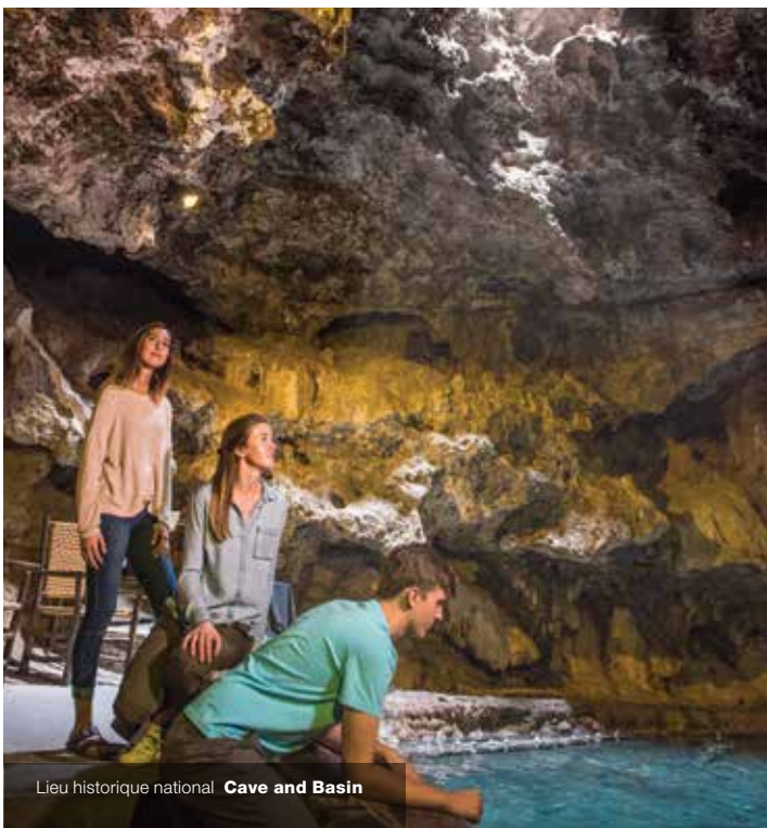
Lieu historique national Cave and Basin

Parcs Canada est un organisme du gouvernement du Canada relevant de la ministre de l'Environnement et du Changement climatique, qui rend des comptes sur les activités de l'Agence au peuple canadien en s'adressant au Parlement. L'Agence administre les programmes liés aux parcs nationaux, aux lieux historiques nationaux et aux aires marines nationales de conservation dans tout le pays. Pour remplir son mandat, le personnel de Parcs Canada travaille sur des sites aux quatre coins du pays et collabore avec les peuples autochtones, les collectivités, les entreprises, les établissements universitaires et les organisations non gouvernementales.