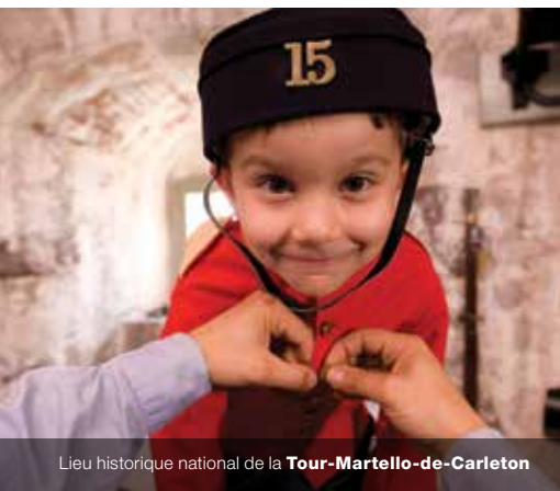
Lieu historique national de la Tour-Martello-de-Carleton

Ce thème porte sur les commentaires visant à encourager un plus grand nombre de personnes à découvrir et à profiter des sites de Parcs Canada, en mettant l'accent sur la diversité (jeunes, citadins, néo-Canadiens et peuples autochtones). Il s'agirait notamment de rendre les services plus accessibles aux familles, aux personnes ayant divers handicaps, aux aînés, aux individus à faible revenu et aux gens qui, pour diverses raisons, n'ont guère l'occasion de profiter du plein air. De nombreux participants ont souligné que les activités devraient être axées sur le monde naturel et encourager davantage de loisirs toute l'année sans toutefois que cela nuise aux écosystèmes locaux.