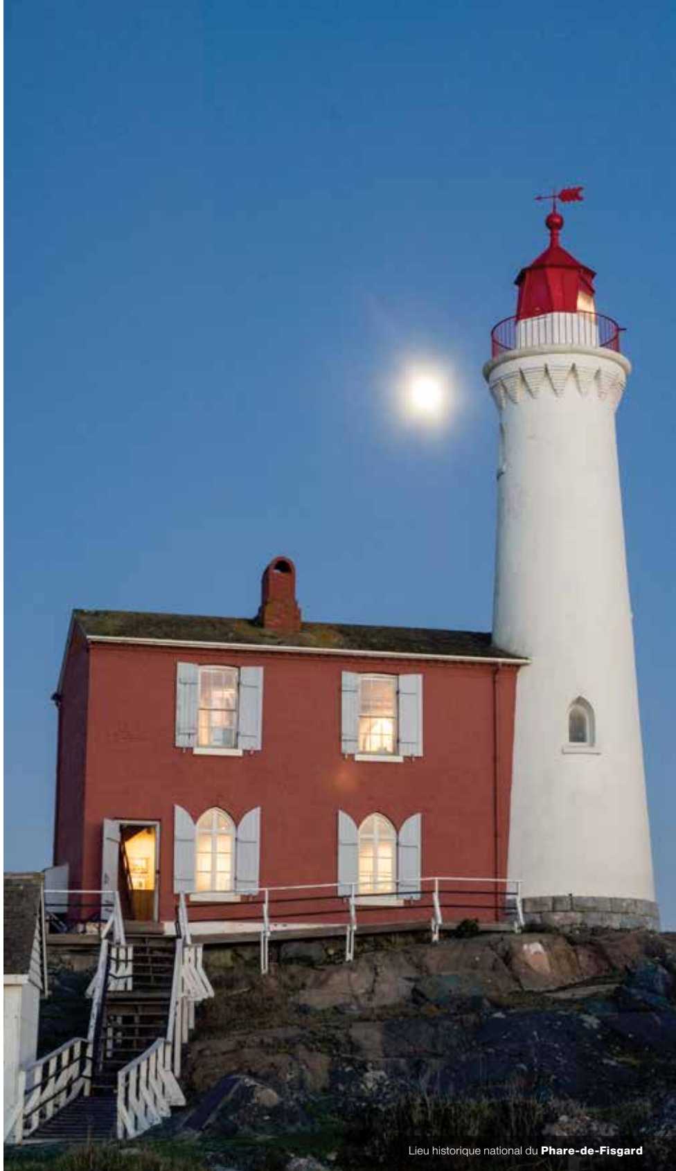
Lieu historique national du Phare-de-Fisgard

Certains intervenants ont insisté sur l'importance de la rigueur scientifique et de la transparence des programmes de surveillance. Les rapports et les évaluations environnementales, estime-t-on, devraient faire l'objet d'un examen par des experts externes avant leur publication. On a également demandé que tous les rapports des séances relevant de l'imputabilité publique (forums de planification, tables rondes ministérielles et évaluations environnementales) soient rendus publics.