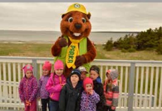
Des îles à la mer