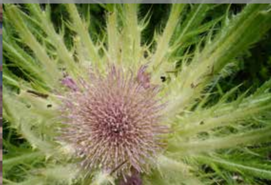
Chardon de Mingan