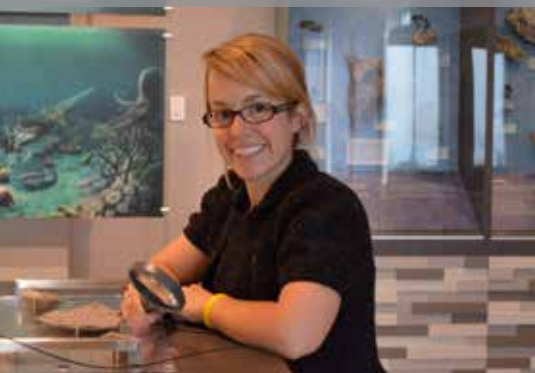
Témoins de la vie aux îles de Mingan