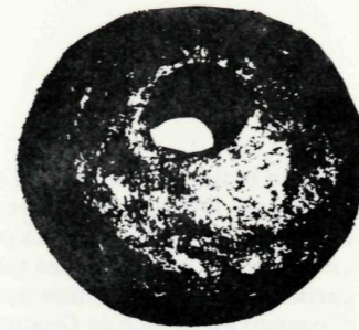
spindle whorl volant de fuseau

Scandinavia and Iceland, the digs uncovered the remains of eight turf houses of Norse type. Several Norse artifacts were also found, as well as evidence of iron working, an art unknown to native North Americans. In addition to these finds, 16 samples of bone, turf and charcoal, dated by the carbon-14 process, yielded an average date close to 1000 AD, when the Norse voyages to America began. Helge Ingstad could hardly have wished for better confirmation of his theory.