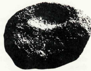
lampe de pierre stone lamp

qu'à l'Anse aux Meadows, à la pointe de la grande péninsule nord de Terre-Neuve, il découvrit un groupe de tertres envahis d'herbe rappelant des emplacements de maisons. L'endroit correspondait à celui de l'histoire de la Saga. C'est ainsi que de 1961 à 1968, Ingstad prit la tête de sept expéditions archéologiques sur le site en question.