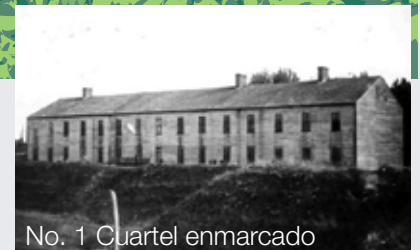
No. 1 Cuartel enmarcado