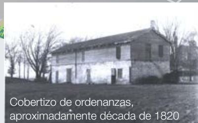
Cobertizo de ordenanzas, aproximadamente década de 1820