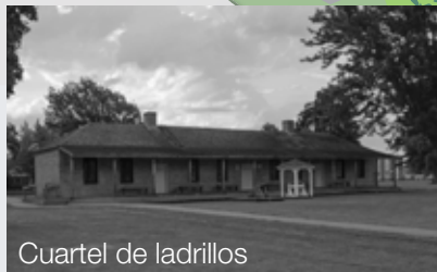
Cuartel de ladrillos