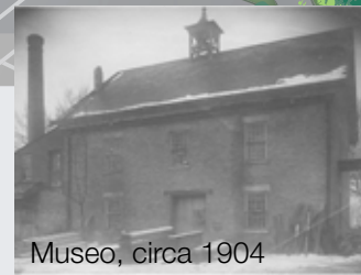
Museo, circa 1904