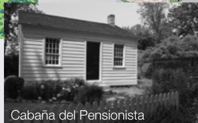
Cabaña del Pensionista