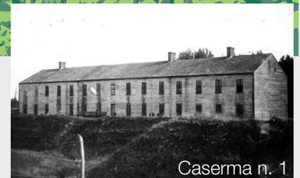
Caserma n. 1