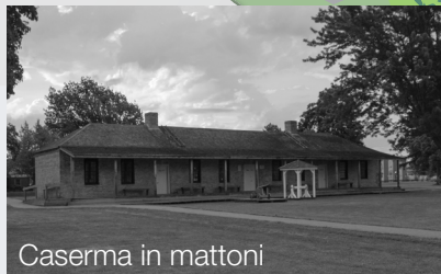
Caserma in mattoni