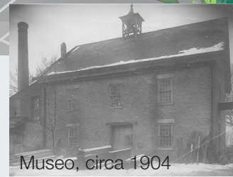
Museo, circa 1904