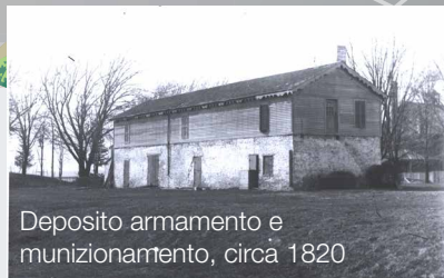
Deposito armamento e munizionamento, circa 1820