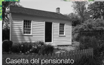
Casetta del pensionato