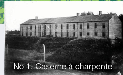
No 1. Caserne à charpente