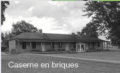
Caserne en briques