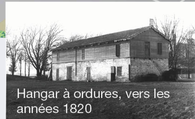
Hangar à ordures, vers les années 1820