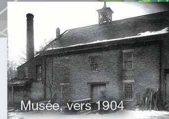
Musée, vers 1904