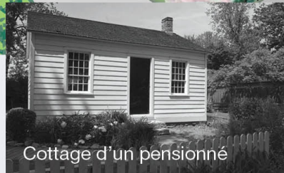
Cottage d'un pensionné