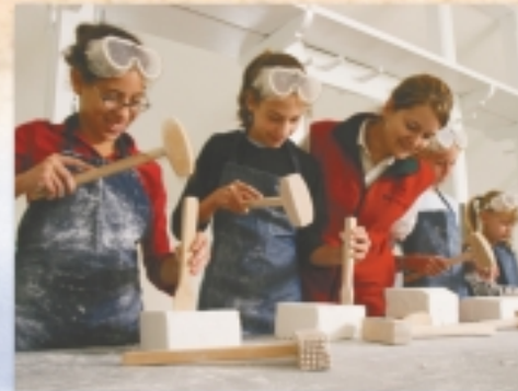
Parcs Canada / N. Rajotte