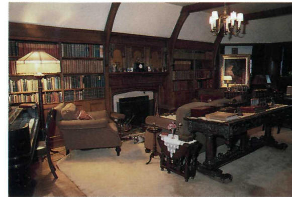
Le bureau de King