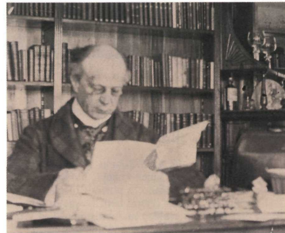
Sir Wilfrid Laurier

Lorsque vous pousserez la porte de la maison Laurier, vous entrerez dans une demeure spacieuse et empreinte d'une sobre dignité. Il y règne l'atmosphère d'une autre époque. Les pièces sont remplies de meubles, de tableaux, de photos et de souvenirs rassemblés pendant un demi-siècle par les deux Premiers ministres qui les ont habités : sir Wilfrid Laurier et William Lyon Mackenzie King.