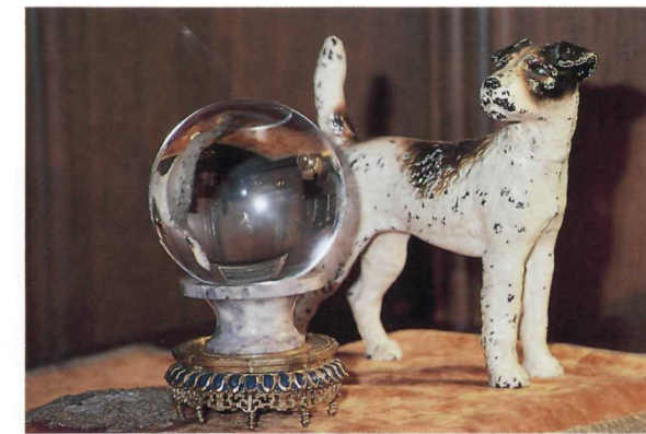
King's crystal ball

Laurier House was transferred to the Canadian Parks Service in April of 1988, and is now part of the system of national parks, national historic sites, and historic canals across the country. Guided tours of the house are available for all visitors.