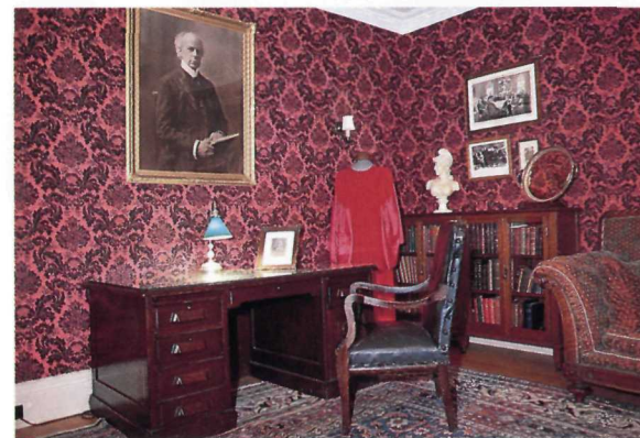
Une pièce consacrée à Laurier

Sir Wilfrid meurt en 1919. Lady Laurier lui survit près de trois ans et, à son décès, lègue la maison à W.L.M. King, le successeur de son mari à la tête du Parti.