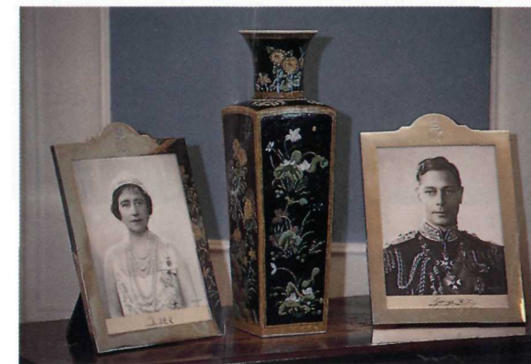
La maison regorge de souvenirs personnels de King. Mementoes are found throughout the house.

En avril 1988, la maison est transmise au Service canadien des parcs. Elle fait dès lors partie du grand réseau des parcs nationaux, des lieux historiques nationaux et des canaux historiques. Tous les visiteurs peuvent bénéficier de visites guidées dans la maison.