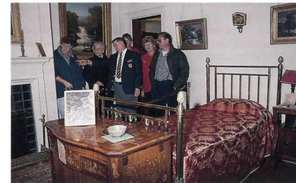
Visitors enjoy a guided tour.

Although the residence is known as Laurier House, the King period prevails throughout, with many of the rooms remaining just as they were during King's time. The house is filled with unusual mementos and