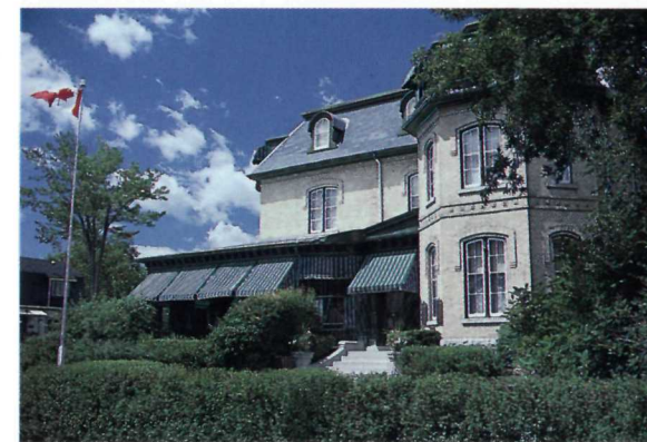
La maison est ouverte toute l'année. The house is open year-round.

Certaines pièces sont consacrées à sir Wilfrid Laurier et contiennent des meubles et des objets qui lui ont appartenu. King se considérait comme le fils spirituel de Laurier, et on voit un peu partout sur les murs des images qui rappellent son souvenir.