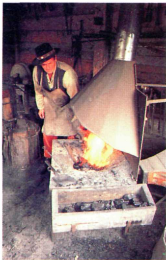
Blacksmith's Forge Forge