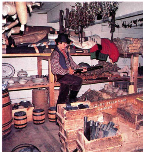
Interior of the Hudson's Bay Company store. L'intérieur du magasin de la compagnie de la baie d'Hudson.