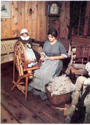
Spinning wool is part of the interpretation of the "Big House". Le filage de la laine fait partie de l'interprétation de la "Grande maison".

COVER Fort Langley was the first permanent fur trade post on the coast of British Columbia.