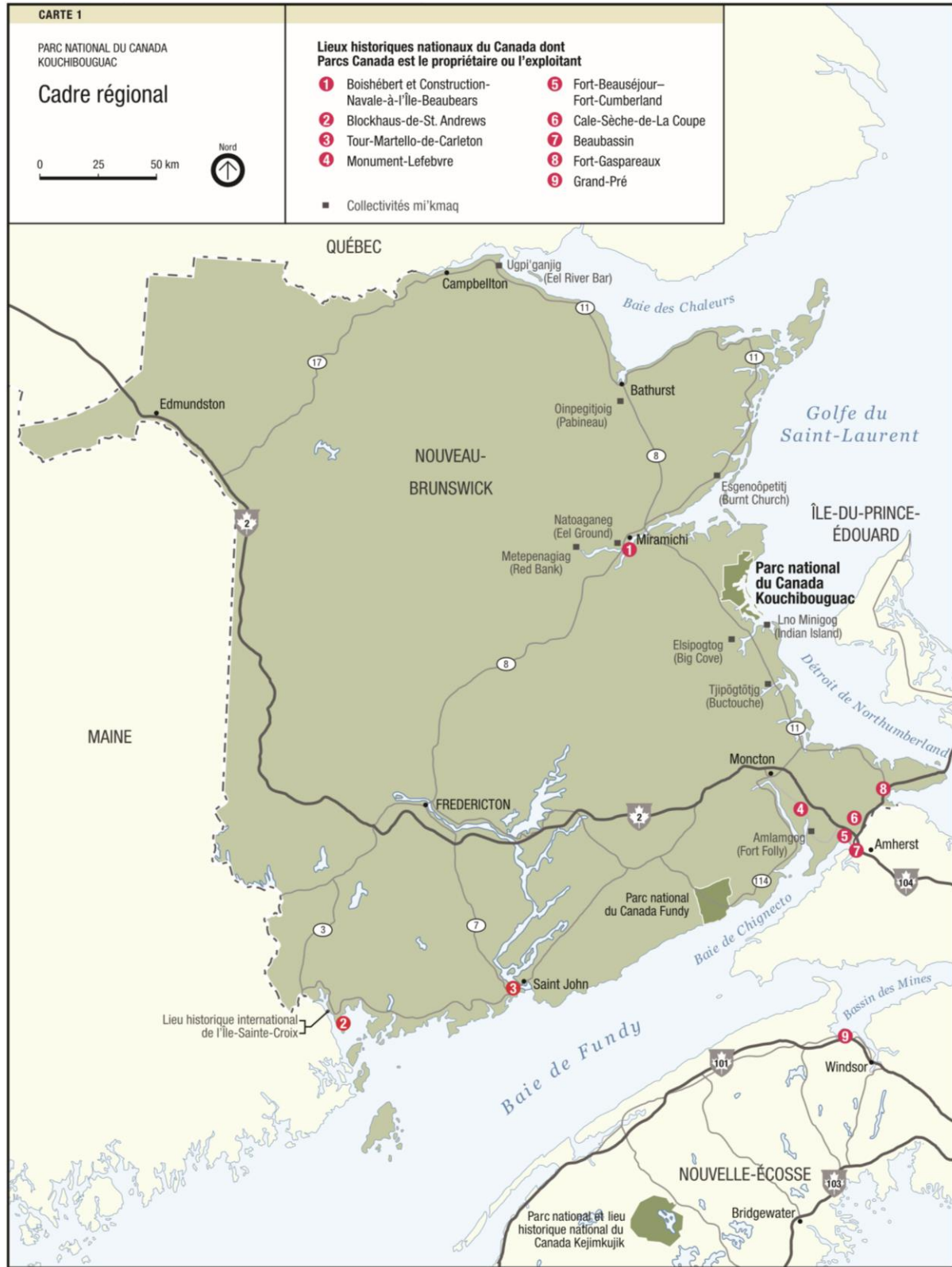
Carte 1 : Cadre régional