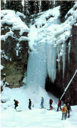
Snowshoeing in Haffner Canyon. En raquettes dans le cañon Haffner.