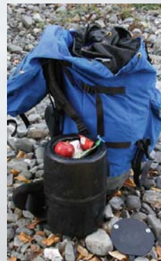
Contenant à l'épreuve des ours

Ne nourrissez jamais les animaux sauvages et gardez toujours vos provisions et vos déchets hors de la portée des animaux. Ne laissez jamais de sac-à-dos contenant de la nourriture sans surveillance. Pour réduire le nombre de conflits avec les animaux sauvages, Parcs Canada oblige les randonneurs à utiliser des contenants à l'épreuve des ours dans certains secteurs, et il en recommande l'utilisation dans tous les secteurs. Vous pouvez en emprunter un lors de votre inscription (moyennant un dépôt).