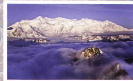
1 Le mont Logan, point culminant du Canada