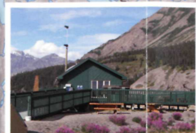
2 Centre d'accueil Thachàl Dhāl