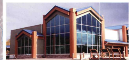
3 Centre d'accueil du parc national Kluane