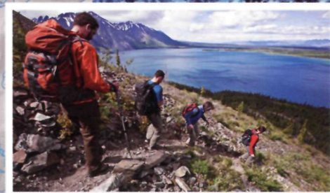
5 Le lac Kathleen vu du sentier King's Throne