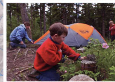
4 Terrain de camping du lac Kathleen